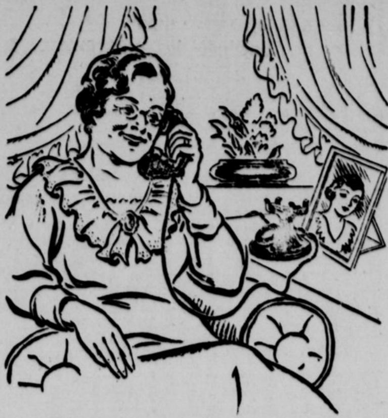
Quand la maison vous semble vide après le départ de Marie pour le pensionnat... que ses lettres se font attendre... et que les vacances sont encore loin...

Servez-vous du téléphone interurbain. Un bout de conversation avec Marie dissipera le vide que crée son absence.