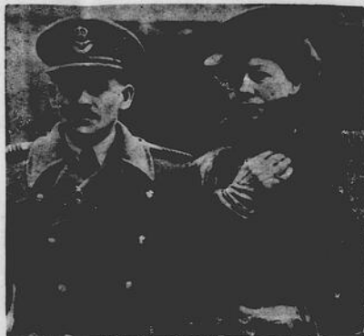
Frank Whittle dell'Aviazione Reale Britannica, fotografato assieme alla moglie all'uscita dal palazzo reale ove gli è stata conferita la croce dell'Ordine dell'Impero Britannico. Whittle è l'inventore dell'Aerocometa, aeroplano a razzo che è d'ideazione italiana.