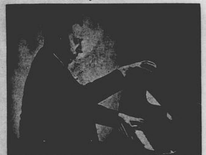
Rubinstein è uno dei più grandi pianisti viventi. Le sue dieci dita elettriche daranno la gioia di una serata artistica a quanti andranno ad ascoltarlo in Montreal.