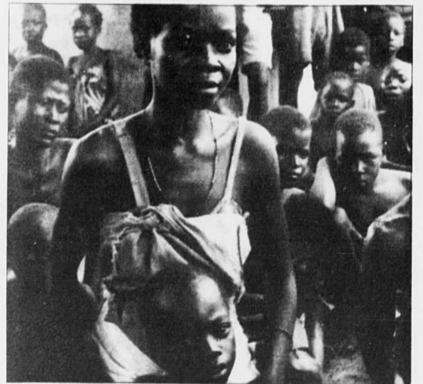
Cette jeune femme et son enfant de six ans viennent de trouver refuge dans l'un des nombreux camps dissimulés au Malawi, après avoir été chassés de leur village au Mozambique par les rebelles du RENAMO.