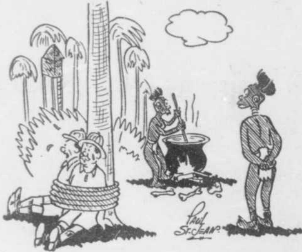
PAS DE CINÉMA, PAS DE RADIO, PAS DE "CLAUDE-HENRI GRIGNON"! JE ME DEMANDE CE QUI PEUT LES RENDRE SAUVAGES!

Mais j'arrête là mes descriptions, car ce soir à bord, il y a mascarade et je veux me rendre compte de l'ingéniosité des concurrents. A la semaine prochaine donc: l'Exposition de Québec et la fin du carnet de voyage.