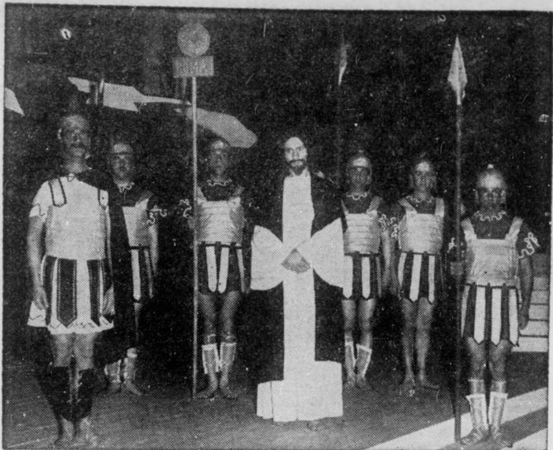
Le Christ, le Centurion et les soldats romains, ces derniers personnifiés par des cadets de la Police de Montréal. "La Passion" par les Compagnons continuera d'être présentée samedi, dimanche, à l'aréna de Saint-Laurent. On peut obtenir ses billets à la porte de l'aréna ou les réserver en téléphonant à AMherst 7739.

Son ambition?... Aller un jour à Paris perfectionner ses études d'art dramatique et de ballet. Mais pour cela, il lui va falloir "attraper bien des commerciaux", comme on dit en langage de radio, pour gagner son passage. Ou bien, tentera-t-il d'obtenir une bourse d'études? Peut-être aussi quelque