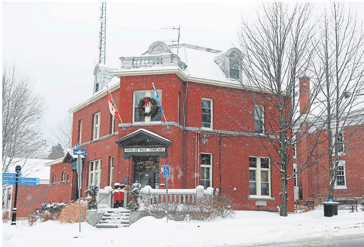
Les employés cols bleus de Lac-Brome ont accepté un contrat de travail de cinq ans prévoyant des hausses de salaires qui peuvent atteindre 13 %.

Les cols bleus, affiliés à la Centrale des syndicats démocratiques, étaient sans convention collective depuis le 31 décembre dernier.