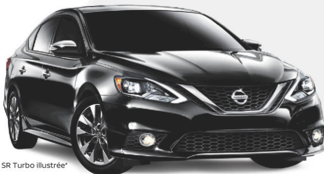
Sentra SR Turbo illustrée*

BIEN ÉQUIPÉE • Régulateur de vitesse • Système téléphonique mains libres Bluetooth 1 • Système de traction asservie • Rétroviseurs extérieurs électriques chauffants