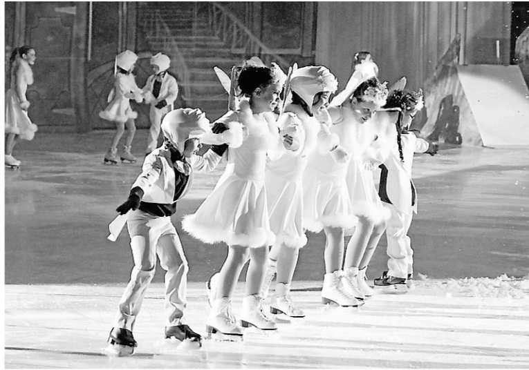
Le spectacle annuel du club de patinage artistique de Granby offre de bons moments.

Les Oréades, une troupe de patinage synchronisé de Cowansville, seront les invités spéciaux.