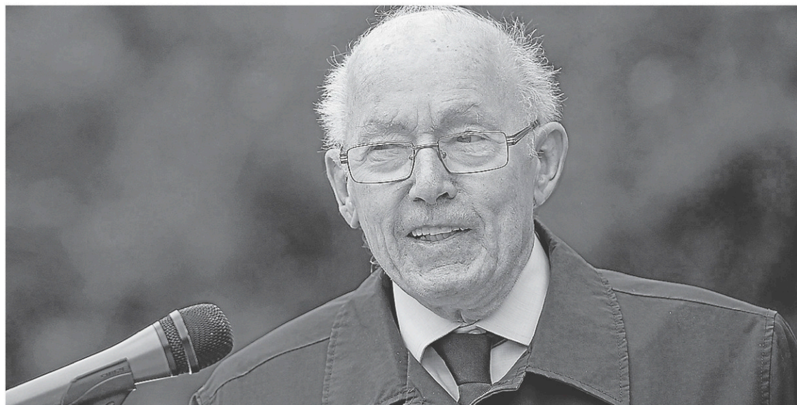
En 2005, Bernard Landry, alors chef du Parti québécois, avait démissionné, parce qu'il était trop déçu de l'appui de 76 % qu'il venait de recevoir.