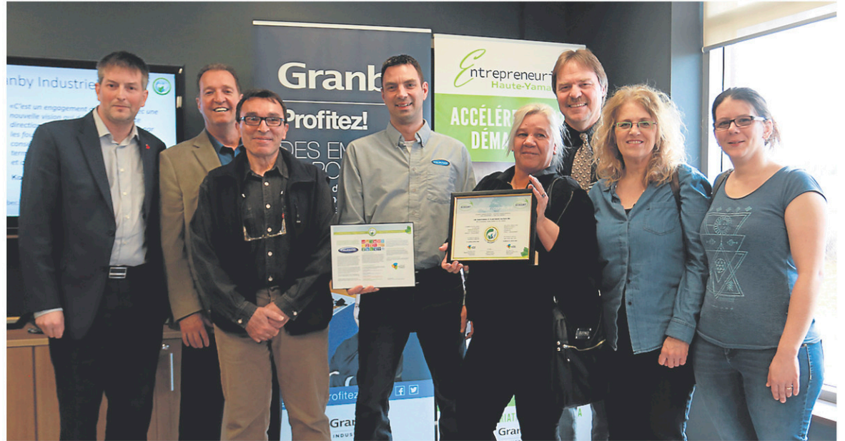
La Fabrique du Matelas, Les caoutchoucs et plastiques Falpaco, Les cartons Northrich, Lippert Components Canada et le service d'échange RapidGaz sont des entreprises désormais écoresponsables.

Le programme de certification Écoresponsable est géré par le Conseil des industries durables (CID) — en fonction de normes reconnues mondialement