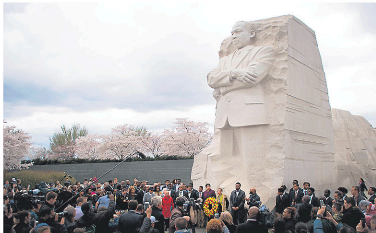
À Washington, la foule s'est réunie autour de la statue du mémorial de Martin Luther King.

« La façon la plus authentique d'honorer mon père est de s'engager pour créer un monde plus juste, pacifique et humain. Que les déclarations coïncident avec des efforts délibérés pour éradiquer la pauvreté, le militarisme et le racisme », a affirmé sur Bernice King. La blessure de sa mort « est encore une source de douleur et d'anxiété. Vous enlevez la croûte et la plaie est encore ouverte », a affirmé le révérend Jesse Jackson, militant emblématique des droits civiques aux États-Unis qui était présent à