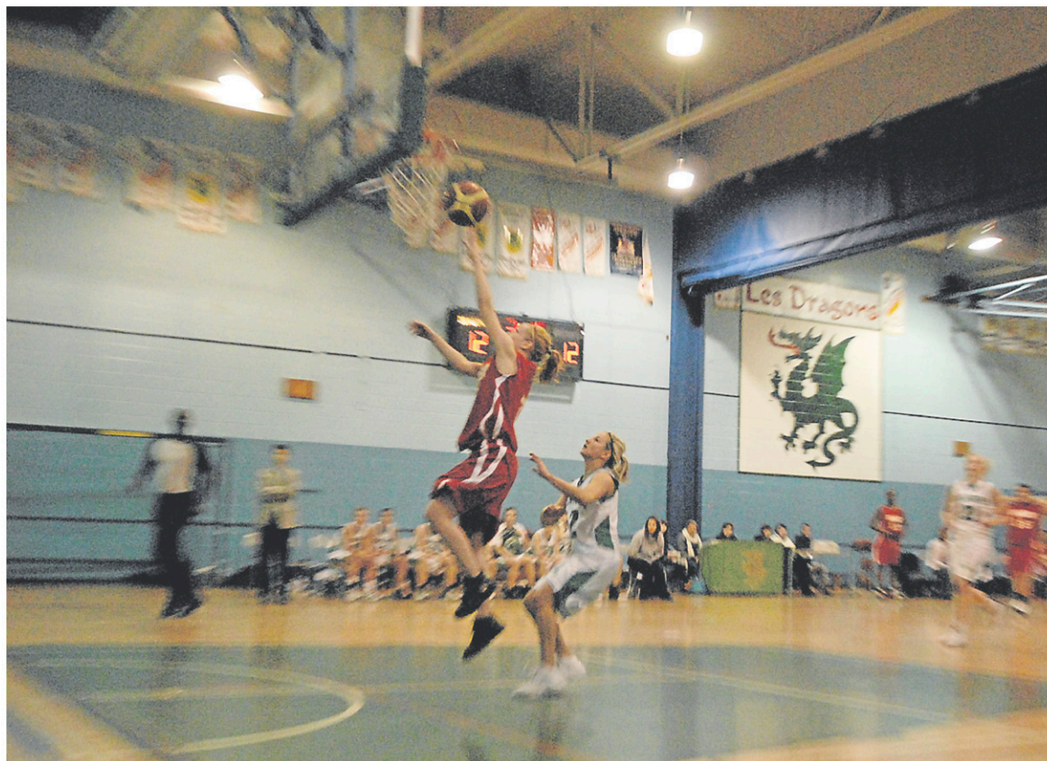
Le poste d'entraîneur de basket-ball n'a pas été comblé cette année à l'école secondaire Joseph-Hermas-Leclerc, à Granby.

JHL regorge d'activités parascolaires comme le football, le volley-ball, le cheerleading et l'improvisation, souligne son directeur. « On a une carte assez diversifiée. D'une année à l'autre, mon objectif est de mettre en place le maximum d'activités parascolaires en