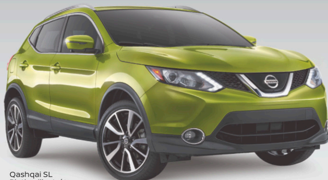
Qashqai SL Platine illustrée*

BIEN ÉQUIPÉE • Régulateur automatique de l'air ambiant bizona • Sièges avant chauffants • Caméra de marche arrière 2 • Système de freinage d'urgence intelligent 3