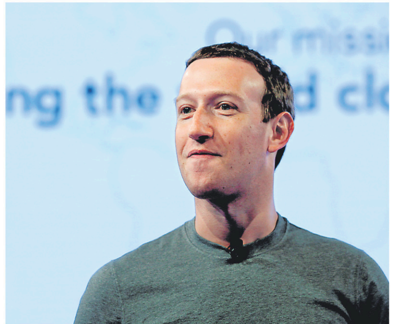
Mark Zuckerberg a reconnu que le réseau social devait mieux contrôler lui-même l'usage des données par les applications tierces.

À l'époque, les applications autorisées par une personne avaient accès aux données de ses amis, ce qui explique le très grand nombre de personnes affectées au final.