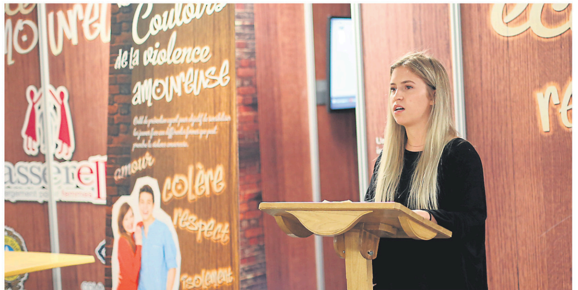
La porte-parole Claudia Bouvette