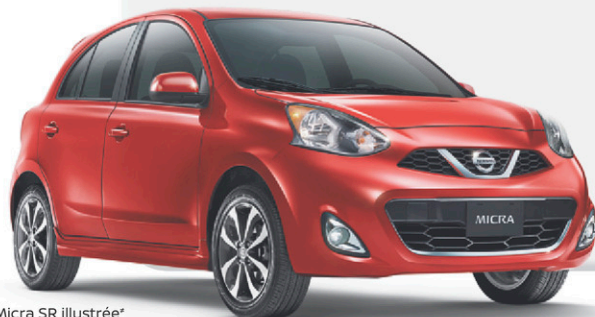
Micra SR illustrée*

LOCATION COURTE DURÉE - PAIEMENTS AVANTAGEUX