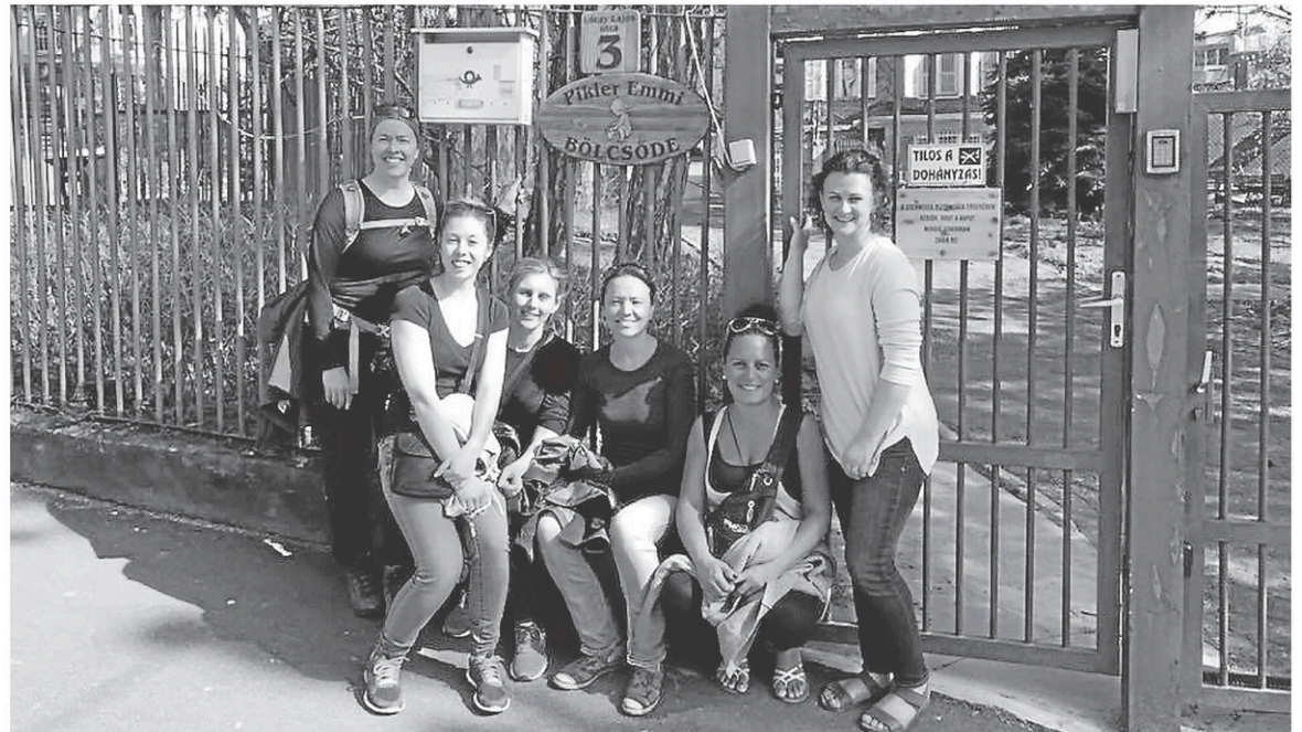
Une délégation du CPE Le Grand Chapiteau est en Hongrie pour participer à un symposium sur l'approche Pikler, mis de l'avant à Granby.

Le CPE Le Grand Chapiteau a adopté cette approche il y a quelques années déjà. Il a participé à l'origine à un projet-pilote avec