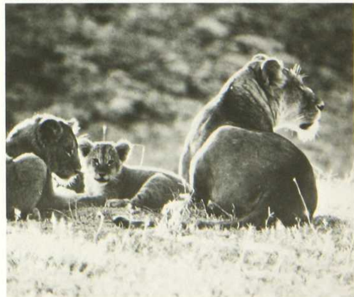
Les Lions de Serengeti