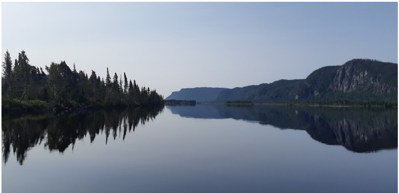
Figure 1 : Rivière-Péribonka, territoire mis en réserve le 15 juin 2022 par le gouvernement du Québec.