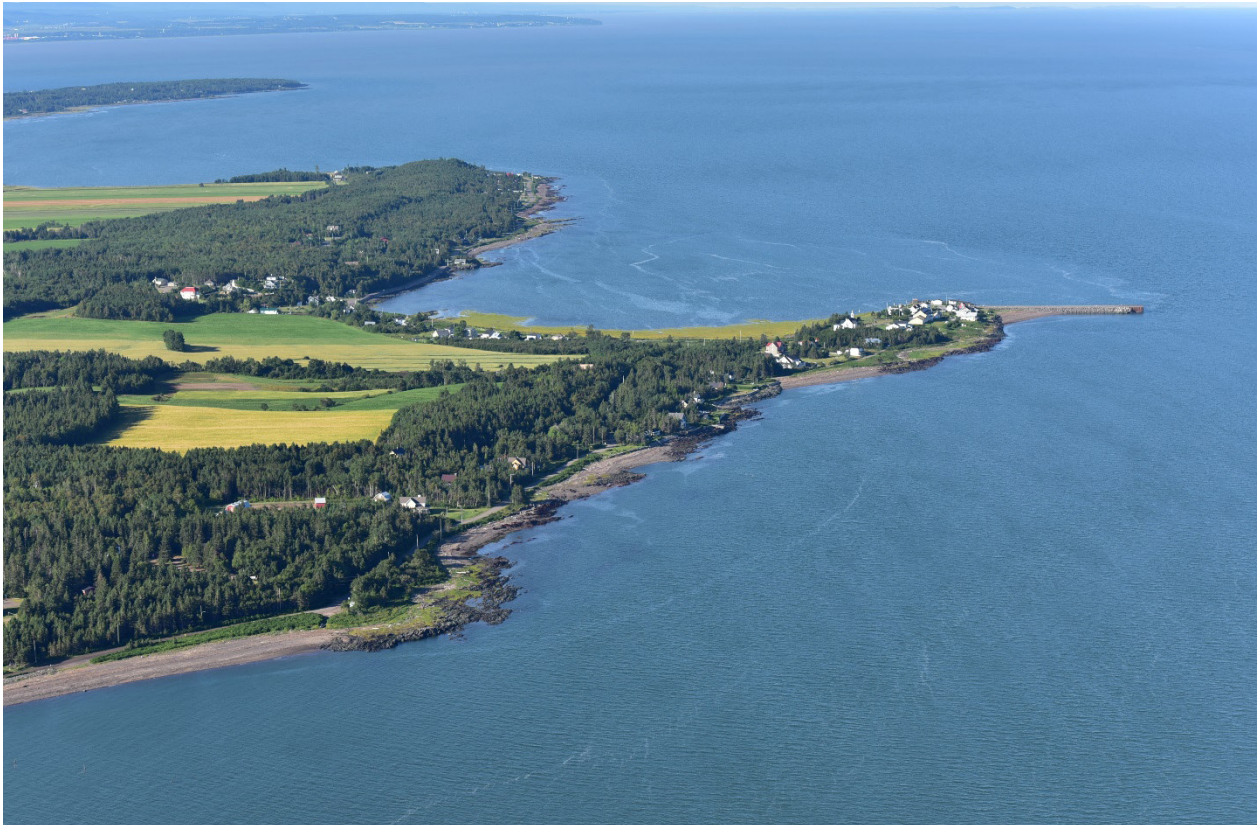
Figure 2 : Paysage culturel patrimonial des Pointes-aux-Iroquois-et-aux-Orignaux

La MRC de Kamouraska a inscrit la demande de désignation de ce territoire dans la stratégie de mise en valeur des paysages de son SAD adopté en 2016.