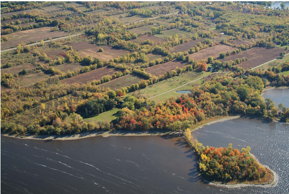
Figure 3 : Paysage humanisé projeté de L’Île-Bizard

La Ville de Montréal, le ministère de l’Environnement, de la Lutte contre les changements climatiques, de la Faune et des Parcs (MELCCFP) et un ensemble de partenaires ont collaboré pour mettre en place un statut de paysage humanisé visant l’ouest de l’île Bizard. En 2015, l’objectif d’obtenir un statut de paysage humanisé a été inscrit dans le SAD de l’agglomération de Montréal. En 2021, le Plan de conservation 12 du paysage humanisé projeté de L’Île-Bizard a été adopté à la suite d’une démarche participative incluant, notamment, une consultation formelle des communautés mohawks de Kahnawake et de Kanasatake.