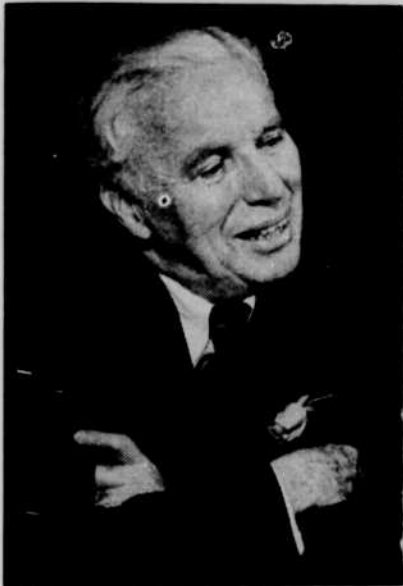
CHARLIE CHAPLIN, à qui de célèbres artistes français rendront hommage à la Revue des Arts et des Lettres, mardi soir, à 9 h. 30. On entendra Colette, Jean Cocteau, Fernand Léger, Marcel Achard et Marcel L'Herbier.