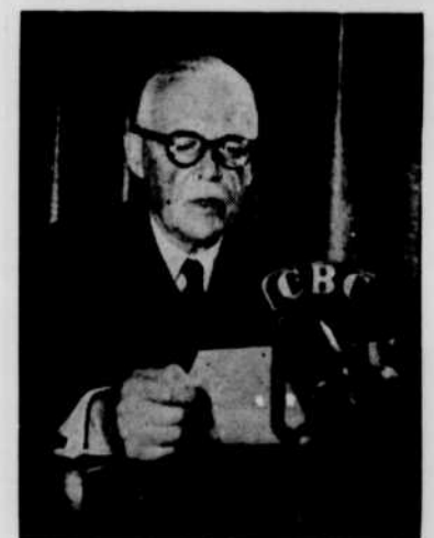
Le T. H. Louis Saint-Laurent qui adressera ses vœux de bonne année aux auditeurs du réseau Français le 31 décembre et le Jour de l'An, à 10 h. 15 du soir.