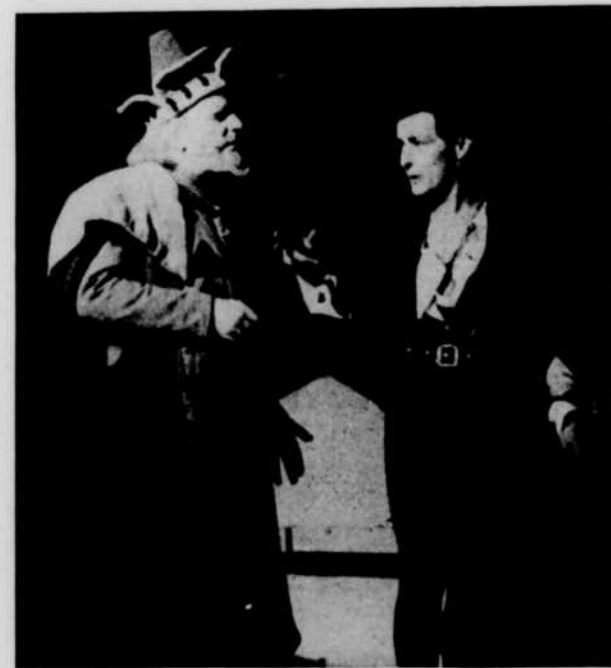
PIERRE BERTIN (Polonius) et JEAN-LOUIS BARRAULT (Hamlet).