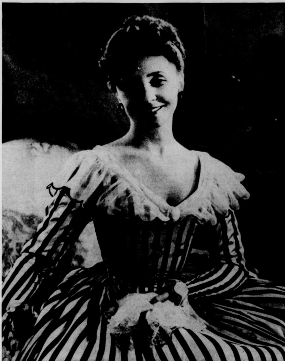
Madeleine Renaud que l'on entendra dans "Amphitryon" de Molière.

Il va sans dire que le réseau Français de Radio-Canada enverra ses représentants à Londres pour cet événement historique. Ceux-ci pourront compter sur la collaboration du personnel du bureau de Radio-Canada à Londres.