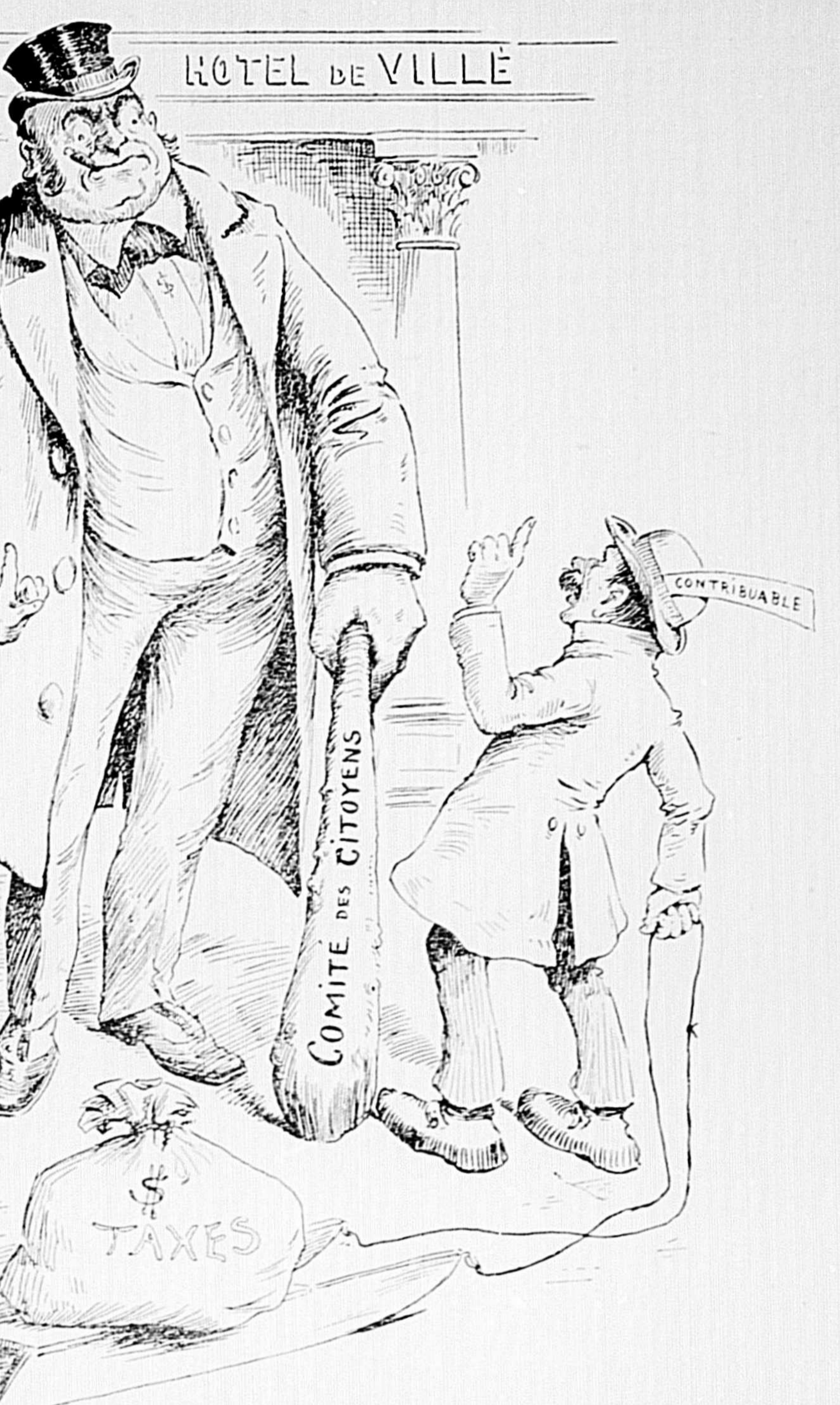
Le comité des Citoyens dans son rôle de dictateur. — Les contribuables n'ont plus droit de penser ni de parler.