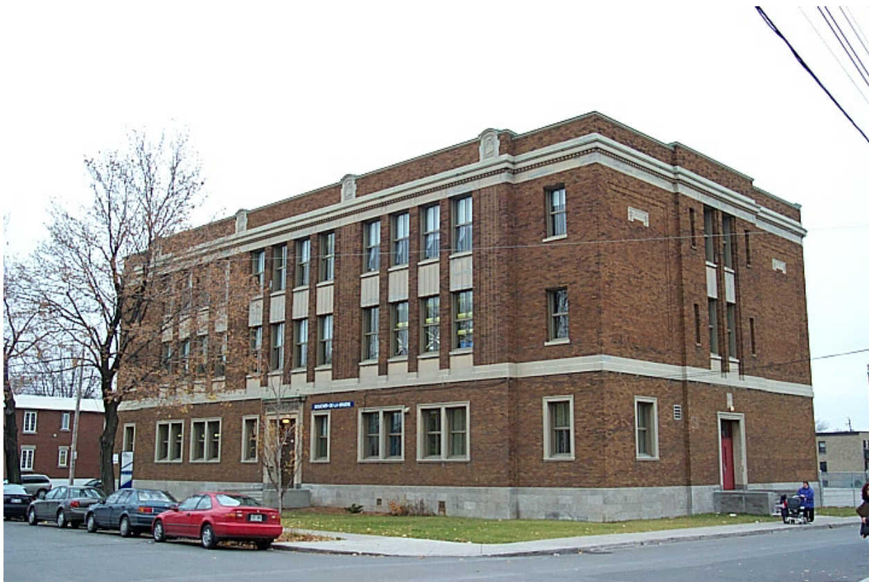
Boucher-de-la-Bruère, rue La Fontaine, vue vers l'Est • Isabelle Bouchard et Gabriel Malo, octobre 2000