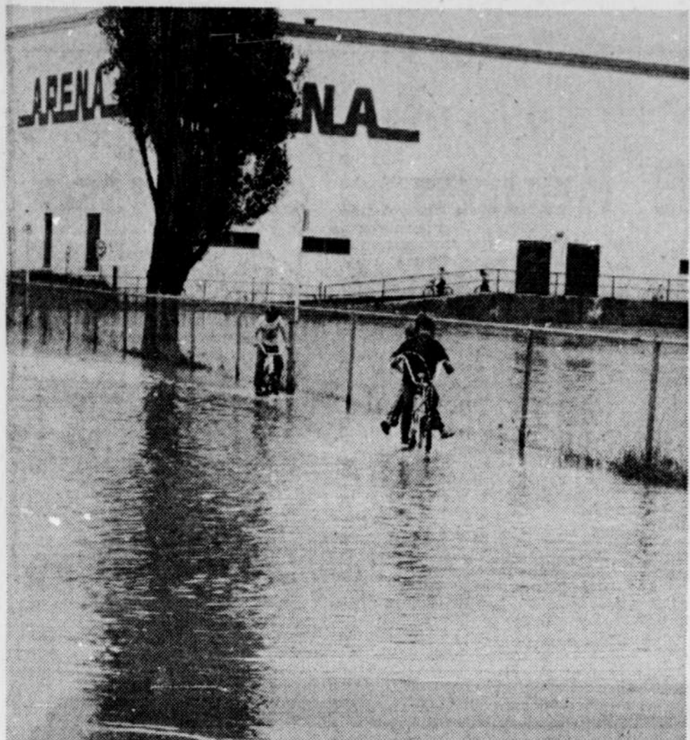
Nouveau jeu pour les jeunes, à Sainte-Marie