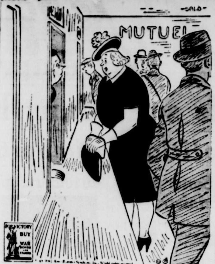
Je veux gager sur le cheval qui a toujours soin de se mettre une couronne de fleurs autour du cou lorsqu'il se fait photographier.

On a déjà commencé à déblayer du terrain dans le sud de la Norvège. Les nazis ont lancé un appel pour des ouvriers "volontaires" de Norvège.