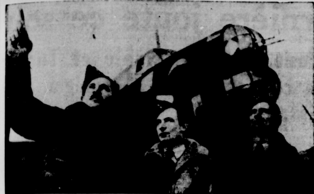
Ces trois Canadiens, membres d'une escadrille de bombardement de la Royal Air Force, passent une partie de leurs loisirs à surveiller l'action de leurs camarades. Ils savent ce qui se passe, là-haut, car le ciel est leur domaine.

Attaques sur l'Angleterre Le contrôle du marché du bétail Londres, 4 (P.C.) — Deux avions allemands sortent des nuages bas au dessus de la côte sud-est de la Grande Bretagne pour s'attaquer à une ville côtière. Une bombe causa des dommages à quelques missions et à une église. Plusieurs personnes furent blessées.