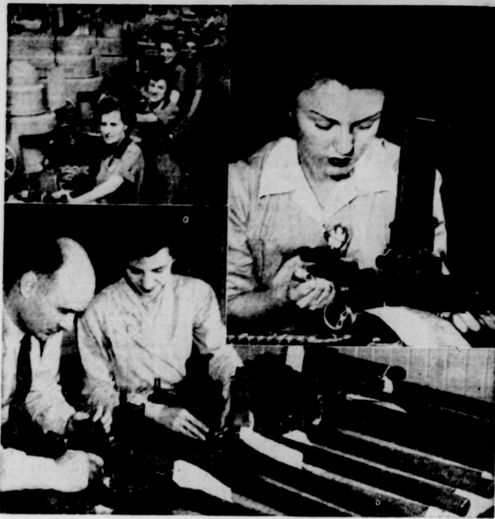
A l'usine moderne de la Border Cities Industries, une filiale de la General Motors, des milliers de jeunes filles sont employées à la fabrication de mitrailleuses Browning. Leurs doigts agiles sont occupés à plus de 1800 travaux différents d'ajustage, de vérification ou de montage. En haut, à droite, une jeune fille ajuste une gachette. En bas, inspection finale après les vérifications du tir.