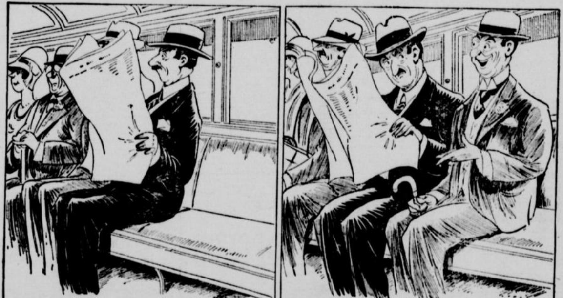
T'AS-PAS DÉJÀ CONTINUÉ CONFORTABLEMENT INSTALLÉ DANS UN TRAMWAY, LA LECTURE DU JOURNAL QUE TU N'AVAS PAS EU LE TEMPS DE TERMINER À LA MAISON—