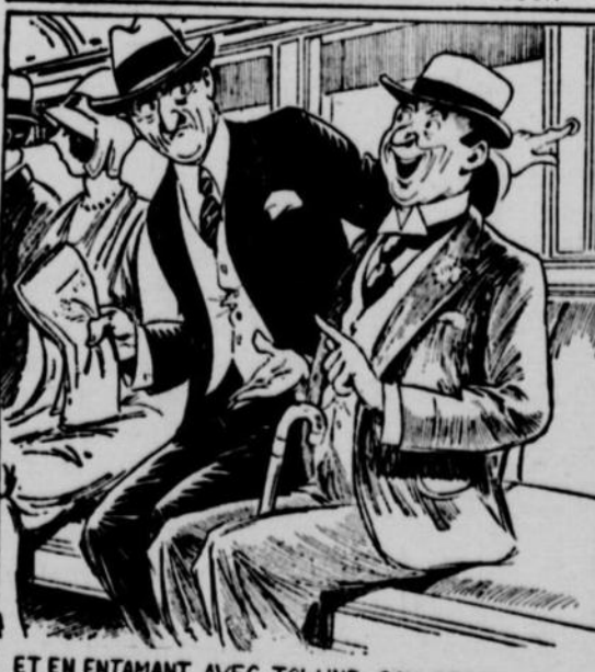
ET EN ENTAMANT AVEC TOI UNE CONVERSATION INSIGNIFIANTE ET PERSISTANTE DONT TU NE PARVIENS À TE DÉBARRASSER QU'ARRIVÉ À TON ARRÊT.