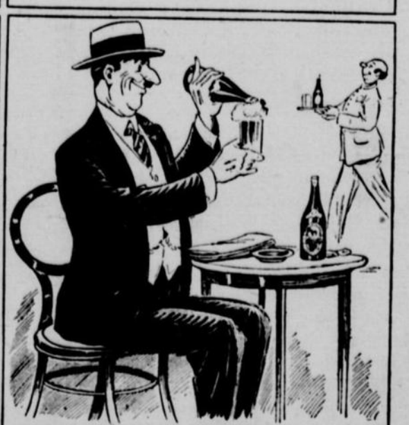
T'AS-PAS, EN DESCENDANT DU TRAMWAY, ESSAYÉ UNE BLACK HORSE? ÇA CHASSE LES IDÉES DE VIOLENCE ET DE MEURTRE.