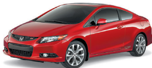
Civic Si Coupé 2012

995 $ comptant Transport et préparation inclus