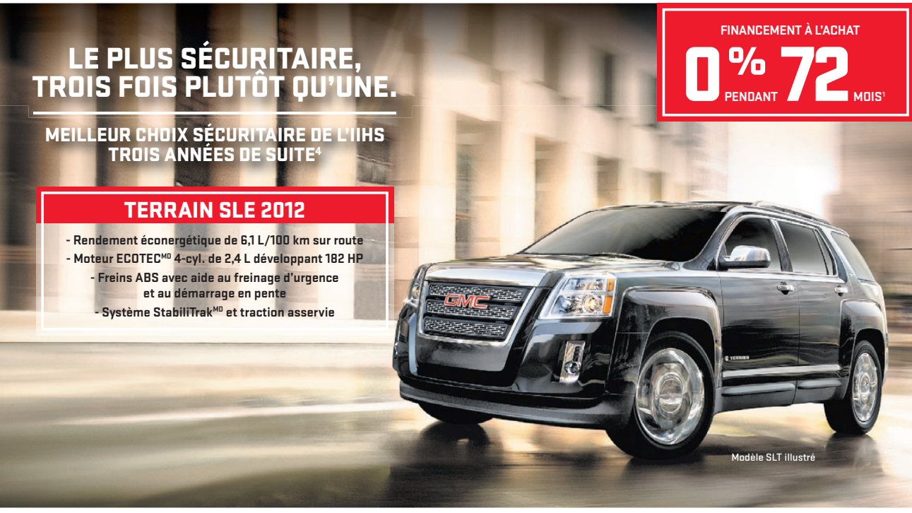
Modèle SLT illustré

LE PLUS SÉCURITAIRE, TROIS FOIS PLUTÔT QU'UNE.