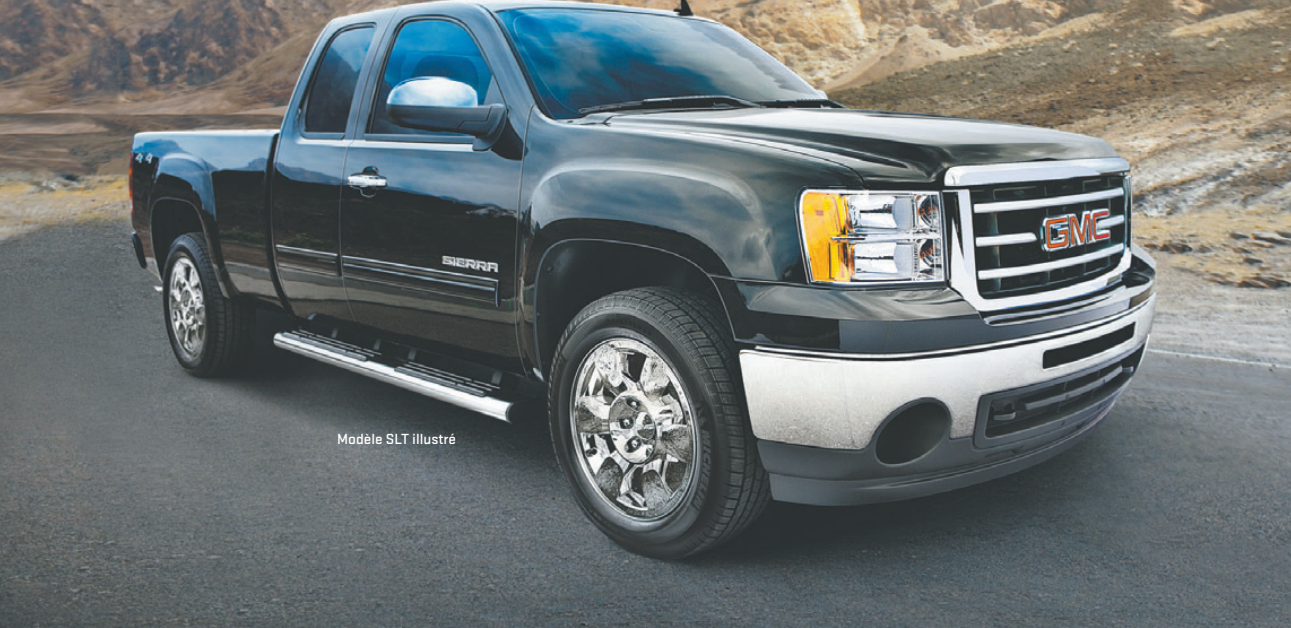
Modèle SLT illustré

FINANCEMENT À L'ACHAT 0% PENDANT 48 MOIS 1