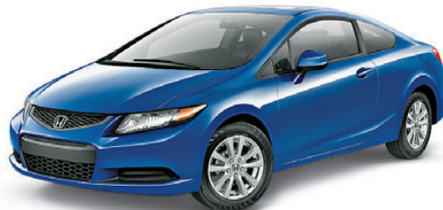
Civic EX-L Coupé 2012