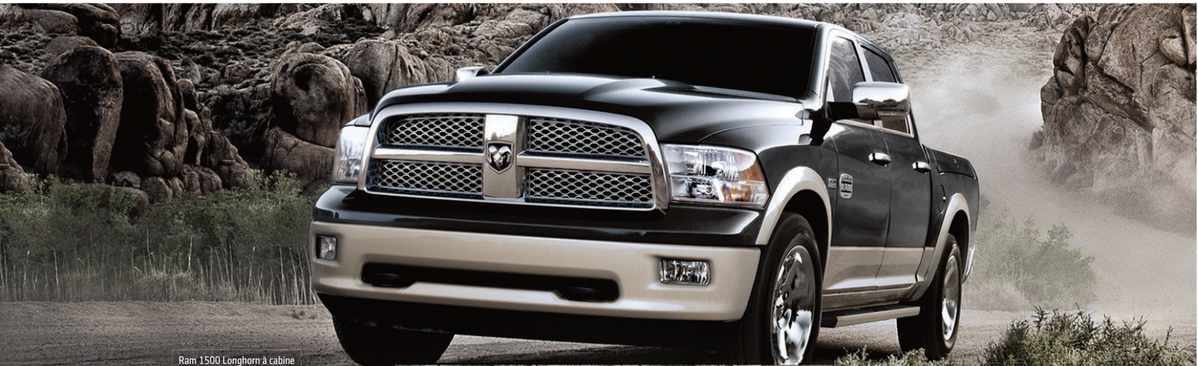
Ram 1500 Longhorn à cabine d'équipe 4x4 2012 montré**