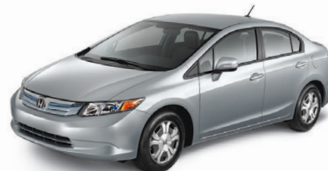
Civic Hybrid 2012

Remise additionnelle disponible avec le programme Faites DE L'Air! †