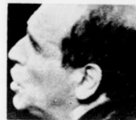
On entendra Léo Ferré et Georges Brassens à "De la musique le long de mes vers", à 2 heures.