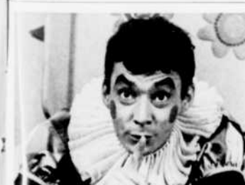
"La Boîte à Surprise", tous les jours à 4 h. 30.