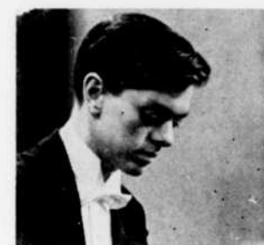
Philippe Entremont est l'invité de "Concert symphonique" à 8 h. 30.