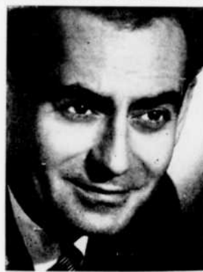
Guy Provost anime "La Vie qui bat" à 5 h. 30.

"L'Histoire d'Otto Frick". Eliot Ness enquête sur le marché clandestin de la drogue. Son action est limitée à cause des implications politiques de cette affaire.