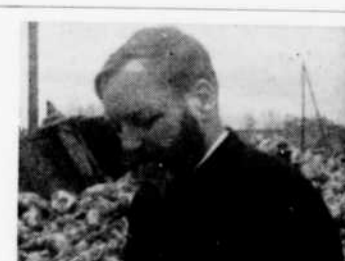
"Nos frères les hommes", le vendredi à 5 h. 30.