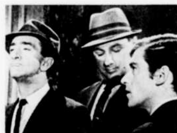
"Les Enquêtes Jobidon", le lundi à 5 heures.