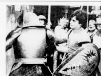
"Thierry la Fronde", le mercredi à 5 heures.