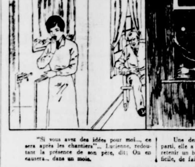
«Si vous avez des idées pour moi...» Une demi-heure plus tard, son cavalier...

Extrait de «Au Cap Blomidon» d'Alonzie de Lestres.