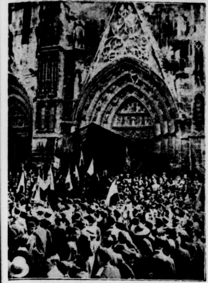
Les grandes cérémonies ont commémoré le 21ème anniversaire de la victoire de la Marne sur les troupes allemandes pendant la Grande Guerre. Voici une photo prise à la sortie de la cathédrale de Meaux au moment où des centaines de vétérans de la fameuse bataille quittaient le saint temple.