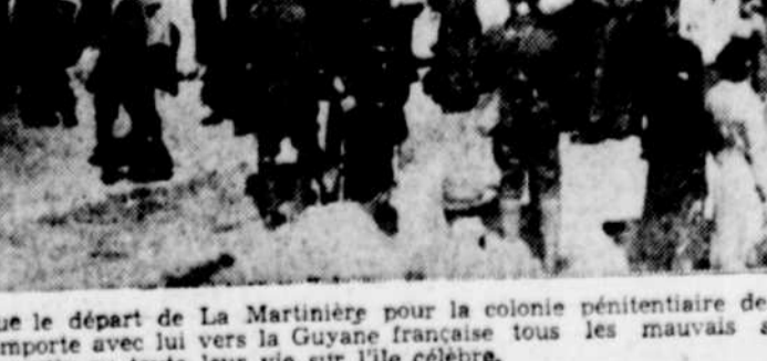
Le départ pour l'île du Diable. Ce vaisseau emporte avec lui vers la Guyane française tous les mauvais sujets condamnés à passer une partie ou toute leur vie sur l'île célèbre.