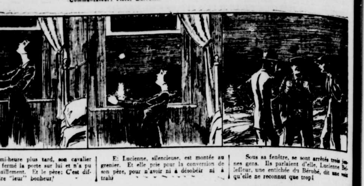
Lucienne, silencieuse, est montée au grenier. Et elle prit pour la conversion de son père, pour n'avoir ni à débâter ni à...

Illustrateur: James McLean. Commentateur: Victor Barrelet.