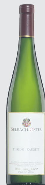
Selbach-Oster Riesling Kabinett Mosel 2011 24,85$

Pas de mention « trocken » sur l'étiquette et 8,5% d'alcool: une garantie que le vin est demi-sec. En effet, mais combiné à l'acidité, le sucre confère plutôt un caractère juteux qui sublime les arômes de pêche et de lime, au lieu d'alourdir le vin. Pour calmer le sucre, servez-le avec un poisson ou une salade d'inspiration thaïe, ou des bouchées qui combinent fromage et fruit.