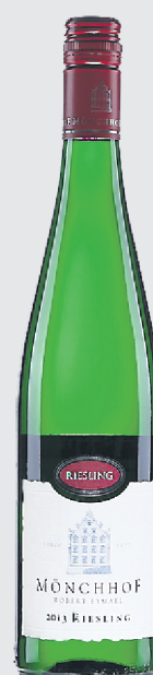
Mönchhof Riesling Mosel 2013 19,40$

Issu d'une année très fraîche, c'est un riesling archisecc, aux notes d'agrumes, de pomme verte et de fleurs blanches. Vif et minéral en bouche, il possède un léger reste de gaz carbonique qui lui confère encore plus de fraîcheur. Parfait pour l'apéritif, avec des poissons ou fruits de mer grillés avec herbes ou agrumes.