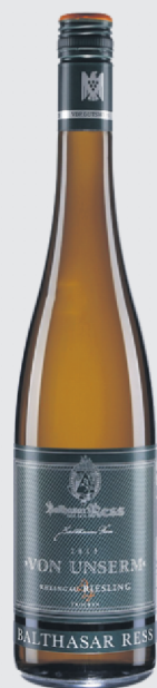
Balthasar Ress Riesling Trocken Rheingau 2013 20,00$

La SAQ met en vedette les vins allemands du 24 mai au 20 juin. Malheureusement, plusieurs sont de la trempe des liebfraumilch. Ceux-ci sont nettement mieux.