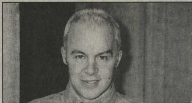
Si ton message n'est pas sincère ça ne passera pas, les jeunes vont te flusher .

J'ai déjà fait l'expérience de les inviter à des scéances de brainstorming . Les messages n'étaient pas clairs et j'ai remarqué une certaine difficulté à cerner le problème. La