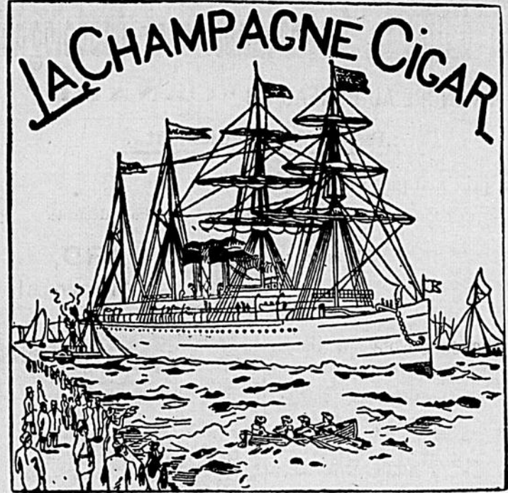
PETIT DUC LA FINE CHAMPAGNE, LA CHAMPAGNE R. V. G. "Ourling Cigar," fait à la main valant 10c pour 5c.

vous seront procurés par l'emploi du Célèbre Vin de Fin Parfumé.