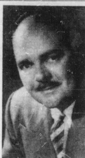
L'HON. LESLIE ROWNTREE, 46 ans, député de Toronto York ouest, est le nouveau ministre du Transport, dans le cabinet Frost.

OTTAWA (PC) — Le gouvernement demande au Parlement d'approuver un bill qui vise à accroître les prêts consentis aux termes de la loi nationale sur l'habitation et à accroître aussi la durée de ces prêts. Le ministre des Travaux publics, M. Walker, a donné avis d'une résolution qui sera présentée aux Communes, proposant quelques amendements à la Loi nationale sur l'habitation, afin d'encourager la construction domiciliaire. La résolution propose que l'on augmente les sommes consenties aux prêts par la Loi nationale sur l'habitation, et que l'on prolonge les périodes de remboursement. Selon les termes de la présente législation, la période de remboursement fixée par la Loi est de 30 ans ou de 25 ans, la plupart du temps. Aux termes de cette législation, le prêt maximum consenti est de $12,800. La résolution de M. Walker ne mentionne pas les nouvelles limites consenties aux prêts ni leur durée de remboursement.