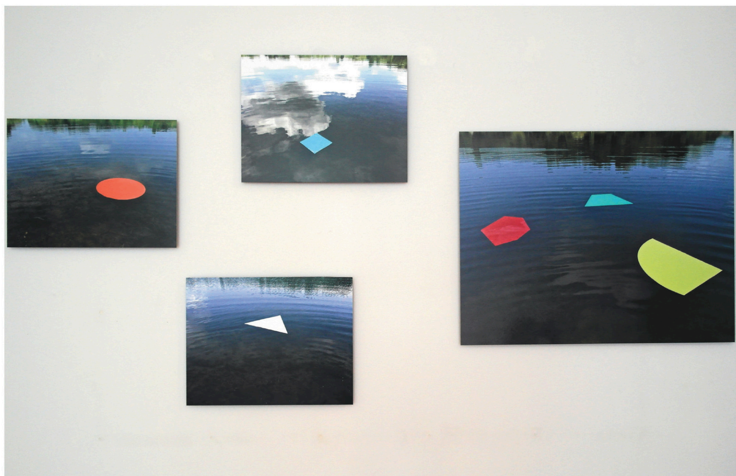
Serge Tousignant, Nymphéas (la géométrie flottante) , 2015