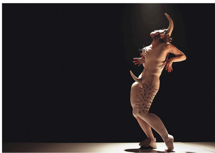
COMPAGNIE MARIE CHOUINARD

Comme point de départ, le corps. Alors qu'elle traversait une période de jeûne, la musique de Stravinski a eu sur elle l'effet d'une épiphanie, tant et si bien que cette symphonie puissante entre en résonance avec sa danse organique toute singulière, où le corps devient un univers habité de plusieurs couches de réalité. «Parce que j'étais dans un état d'hypersensibilité, j'entendais la musique