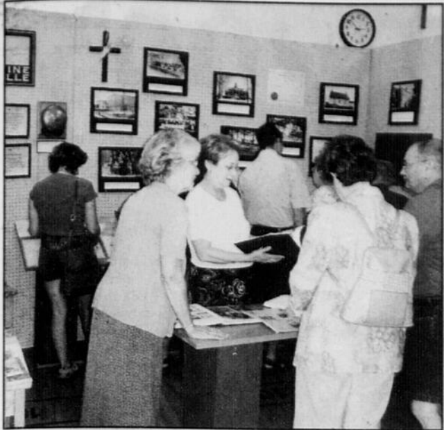
L'espace occupé par la Société d'histoire de Princeville, à la salle Pierre-Prince, a attiré beaucoup de gens, en fin de semaine, dans le cadre de la Foire champêtre et culturelle de Princeville.