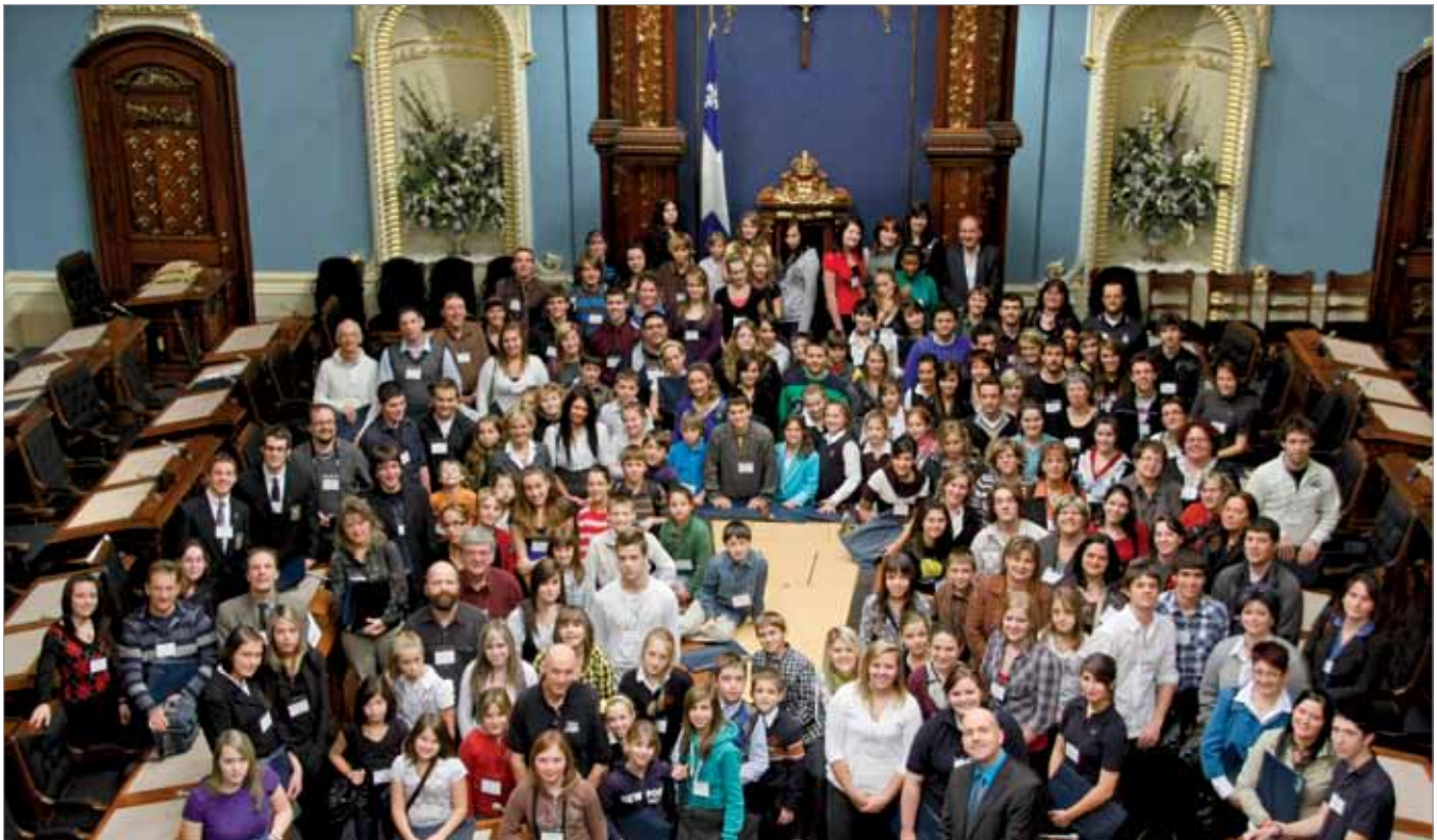
Plus de 180 personnes ont assisté à la journée de formation à la salle du Conseil législatif de l'hôtel du Parlement.

Il est à noter qu'afin de bonifier le guide pédagogique L'ABC des Parlements au primaire ou d'améliorer, le cas échéant, l'offre de service de la Fondation à l'ensemble des écoles primaires du Québec pour l'année scolaire 2010-2011, les écoles inscrites en date du 14 février 2010 ont été invitées à remplir un formulaire d'évaluation.