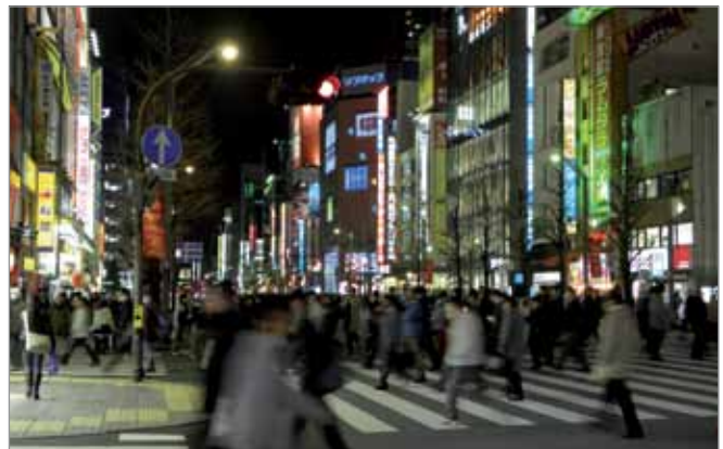
Rue de Tokyo le soir