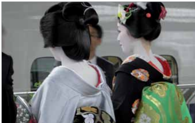
Deux Japonaises dans le Shinkansen (train haute vitesse)