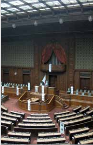
Chambre des représentants Diète

Du 22 février au 9 mars 2010, les boursiers stagiaires ont mené une mission exploratoire au Japon. La mission est l'occasion pour les boursiers stagiaires d'établir une comparaison entre le système politique québécois et celui d'un autre pays.