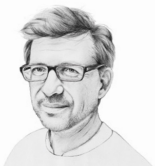
Fabrice Hadjadj est philosophe et dramaturge. Il dirige l'Institut Philanthropos, à Fribourg, en Suisse.

Beaucoup, cependant, risquent comme moi de retomber dans le charnel. Le site Pornhub a récemment publié la liste des mots-clés qui ont défini les catégories les plus recherchées par ses utilisateurs en 2022. Or, croyez-le ou non, celui qui vient en première place, c'est « reality » (+ 169 %) avec « real homemade » (+ 310 % aux États-Unis). Si les utilisateurs recherchent ainsi une sexualité réelle et « faite maison », il est à craindre que, comme moi, ils ne finissent par suivre les enseignements de l'Église catholique. ■