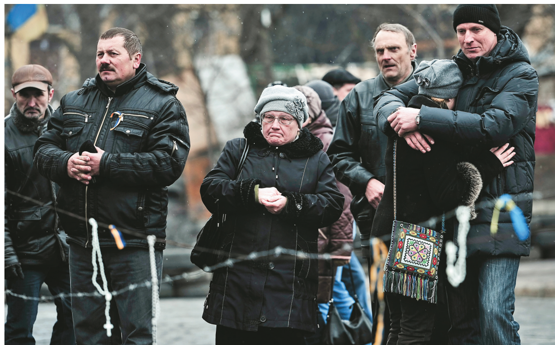
Des gens de tous âges et de tous milieux se recueillent sur la place de l'Indépendance dimanche à Kiev.

Néanmoins, une porte-parole de son parti a indiqué à l'AFP que l'ancienne prisonnière allait consacrer sa première journée de liberté à rencontrer des ambassadeurs occidentaux avant de rendre visite à sa mère, à Dnipropetrovsk, dans l'est du pays. Une entrevue avec la chancelière allemande, Angela Merkel, est déjà en préparation. Les deux femmes « ont convenu de se rencontrer très prochainement », a indiqué le parti Batkivchtchina dans un communiqué. Mme Merkel a salué la libération de Mme Timochenko et a souligné que son retour dans la grande politique serait un facteur important pour stabiliser la situation en Ukraine, préserver l'unité et la remet-