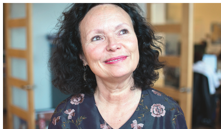
MICHAËL MONNIER LE DEVOIR

Ce studio mobile de production vidéo qu'elle a fondé en 2004, avec l'aide de l'ONF et des Premières Nations, était un vœu en marche. En réponse à l'énorme taux de suicide des jeunes des communautés amérindiennes, à leur No future , elle