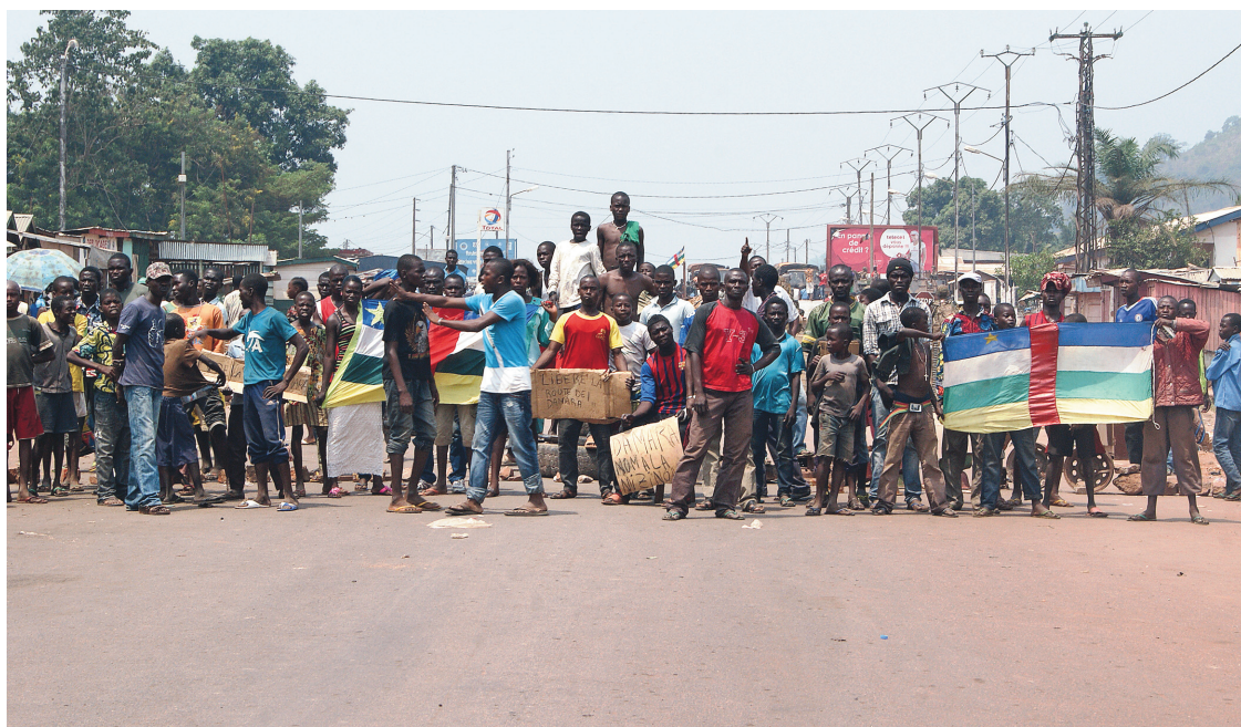
À la mi-février, des chrétiens du secteur PK12 de Bangui formaient une barrière humaine pour empêcher l'aide humanitaire internationale d'arriver aux réfugiés musulmans.

Il y a quelques semaines, je visitais le camp «École Liberté» à Bossangoa, où les résidents musulmans craignent des représailles et ne pouvaient imaginer le retour à une situation normale. Malgré la protection des forces de l'Union africaine et de leurs voisins français, les Casques bleus, dans