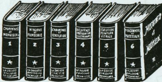
RELIURE ROUGE MANDARIN

MENUISIERS PEINTRES PLOMBIERS BRIQUETEURS ÉLECTRICIENS