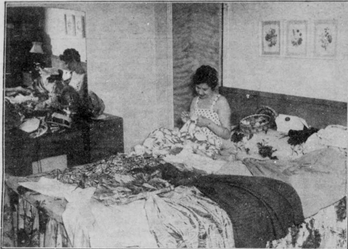
Un point ici, un point là, une agraffe à cette robe, un bouton à cette jupe. Une Canadienne se doit d'être impeccable. Surtout une artiste. Et puis dans une aussi jolie chambre, aux murs saumon et au mobilier d'ébène blond, la tâche est aisée.