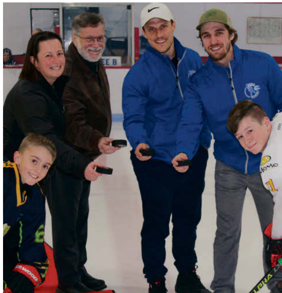
Le comité organisateur de la 52 e édition du tournoi provincial de hockey de Valcourt lors de la lancée officielle de l'événement.

Une fois de plus, la prolongation a joué en faveur des Hawks qui ont récolté la médaille d'or, grâce à une victoire de 3 à 2.