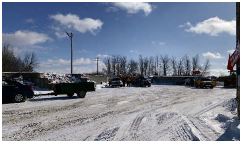
L'accès hivernal a attiré 285 personnes l'an dernier.

Rappelons que l'écocentre a fermé ses portes le 27 novembre et reprendra pleinement du service le 26 avril.