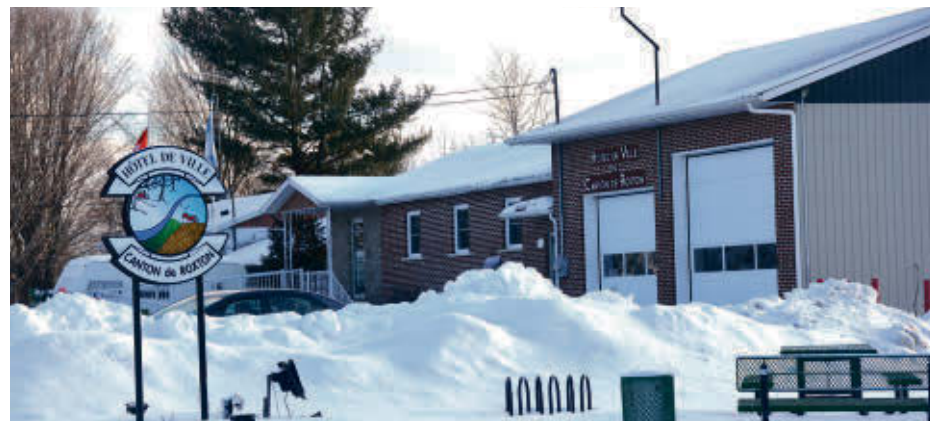
Un nouveau rôle triennal d'évaluation a fait son entrée dans le Canton de Roxton faisant bondir de 29 % le prix de vente des propriétés.

Pour 2024, c'est l'achat d'un ordinateur qui est prévu au coût de 2000 $ ainsi que le réaménagement de l'intersection du 5 e Rang et du chemin Shefford d'une valeur de 100 000 $.