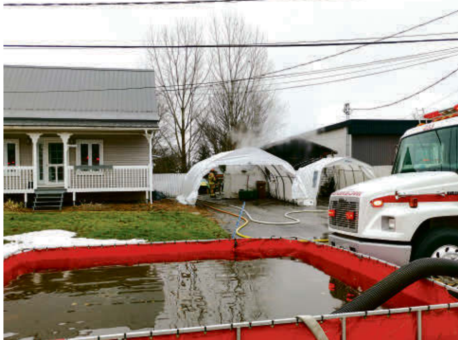
Lors de l'incendie du 1 er janvier sur la rue Brasseur à Upton, le Service d'incendie d'Upton a utilisé le bassin d'eau plutôt que la borne-fontaine située à quelques mètres des lieux.