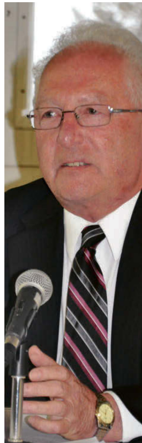
Le maire de la Municipalité de Roxton Falls, Jean-Marie Laplante.

Ce projet était cependant déjà prévu au budget 2022 grâce à une appropriation de surplus de 185 000 $. Ce montant était puisé à même la réserve des sommes provenant de la vente des terrains du développement domiciliaire. C'est pourquoi on note une baisse des affectations passant de 217 500 $ à 19 120 $.