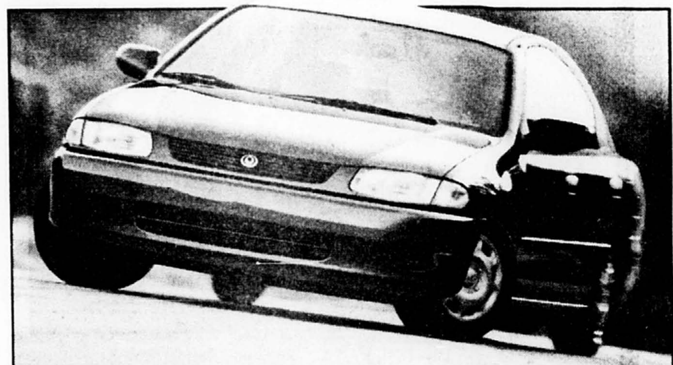
Mazda Protegé SE 1997

Les résultats du sondage sont fondés sur des entrevues téléphoniques faites auprès de 1004 personnes entre le 31 septembre et le 5 octobre. Un échantillon de cette taille comporte une marge d'erreur de 3,1 points de pourcentage, 19 fois sur 20. Au Québec, l'échantillon est de 268 entrevues et la marge d'erreur est alors de 6 points de pourcentage, 19 fois sur 20.