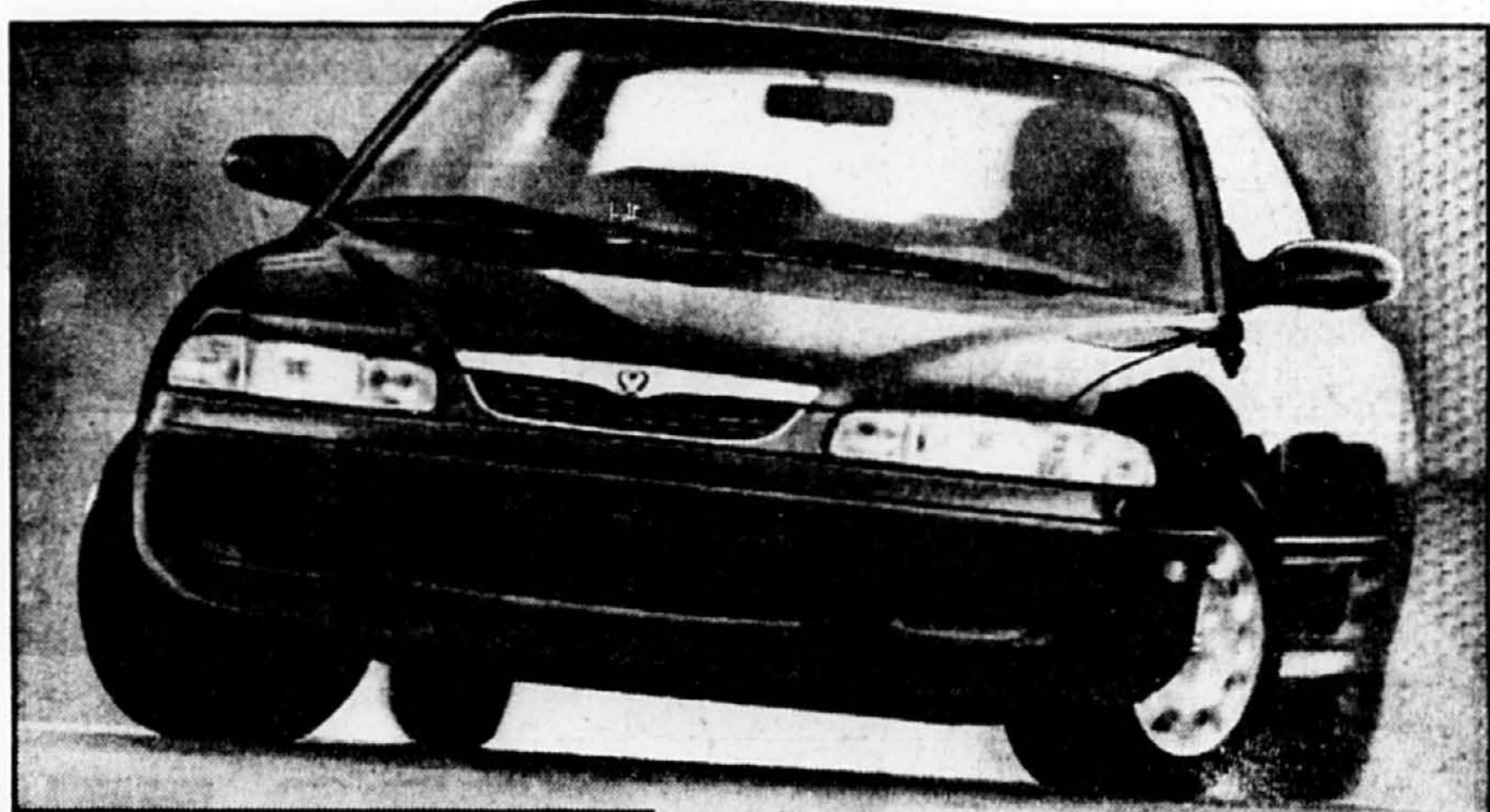
Mazda 626 LX 1997

Environ 16 000 volontaires se sont enrôlés, assure l'équipe de campagne de Dole. Pour elle, il est « nécessaire d'avoir une présence visible » sur le Web, meilleure façon d'atteindre les jeunes générations qui vivent à l'heure de la technologie ». Cinq personnes y travaillent, et le site reçoit en moyenne 125 000 hits par jour, avec un record de deux millions de hits après que Bob Dole eut donné son adresse Internet dimanche lors du débat présidentiel télévisé.