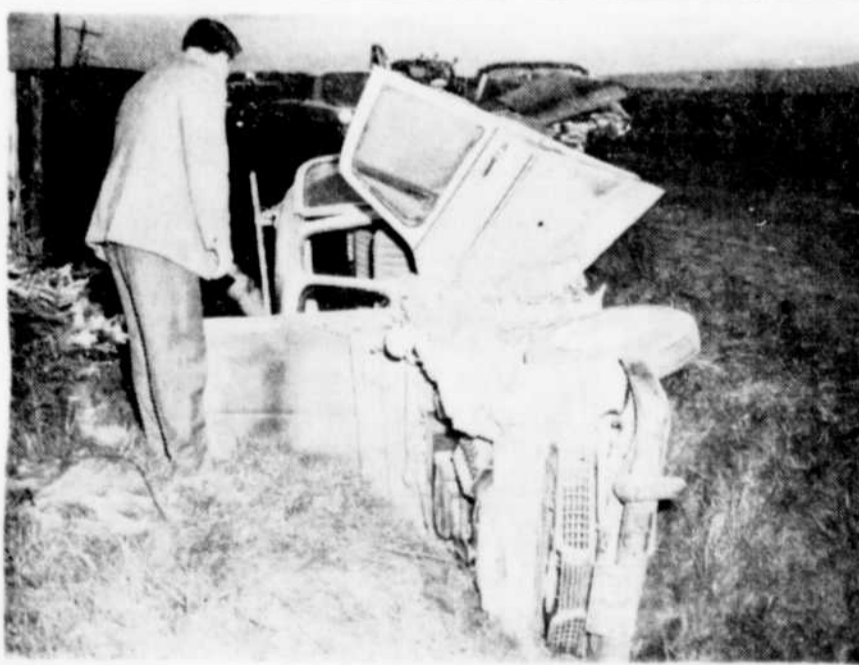
DEUX AUTOS... — Deux automobiles ont été impliquées dans une collision survenue vers 7h 30, samedi soir, sur la route 28, entre Bury et Cookshire, à environ 5 milles de Cookshire. Apparemment il s'agit d'une collision frontale. Deux personnes ont été blessées dans cet accident, et elles ont été conduites à l'hôpital St-Vincent-de-Paul, de Sherbrooke. Il a été impossible d'obtenir le nom des personnes impliquées dans cette collision. Sur la photo, on aperçoit, à l'arrière-plan, le deuxième véhicule.