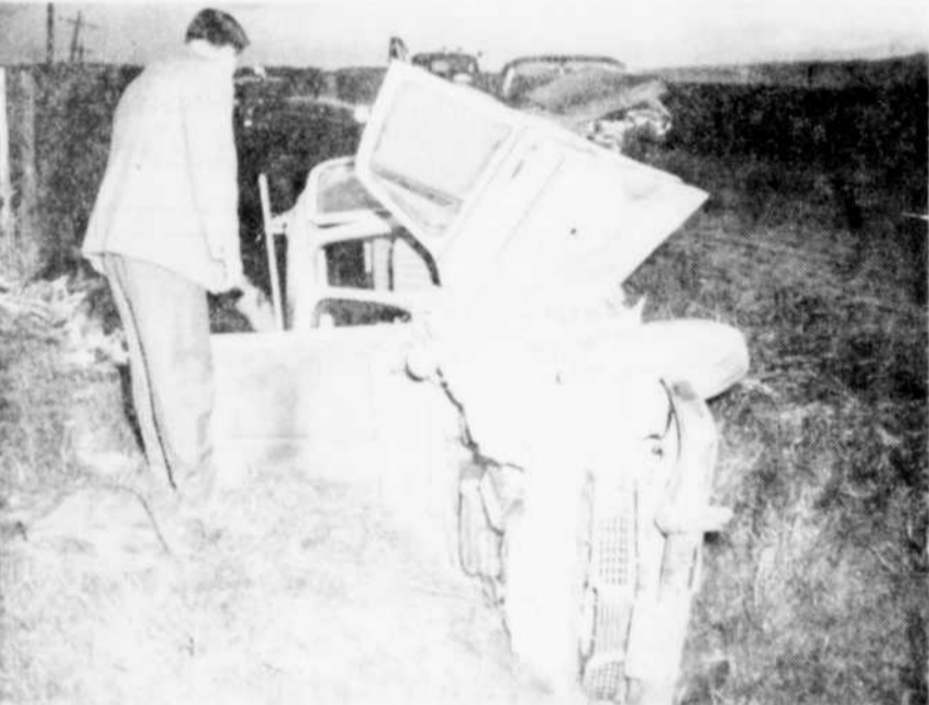
DEUX AUTOS... — Deux automobiles ont été impliquées dans une collision survenue vers 7h 30, samedi soir, sur la route 28, entre Bury et Cookshire, à environ 5 milles de Cookshire. Apparemment il s'agit d'une collision frontale. Deux personnes ont été blessées dans cet accident, et elles ont été conduites à l'hôpital St-Vincent-de-Paul, de Sherbrooke. Il a été impossible d'obtenir le nom des personnes impliquées dans cette collision. Sur la photo, on aperçoit, à l'arrière-plan, le deuxième véhicule.