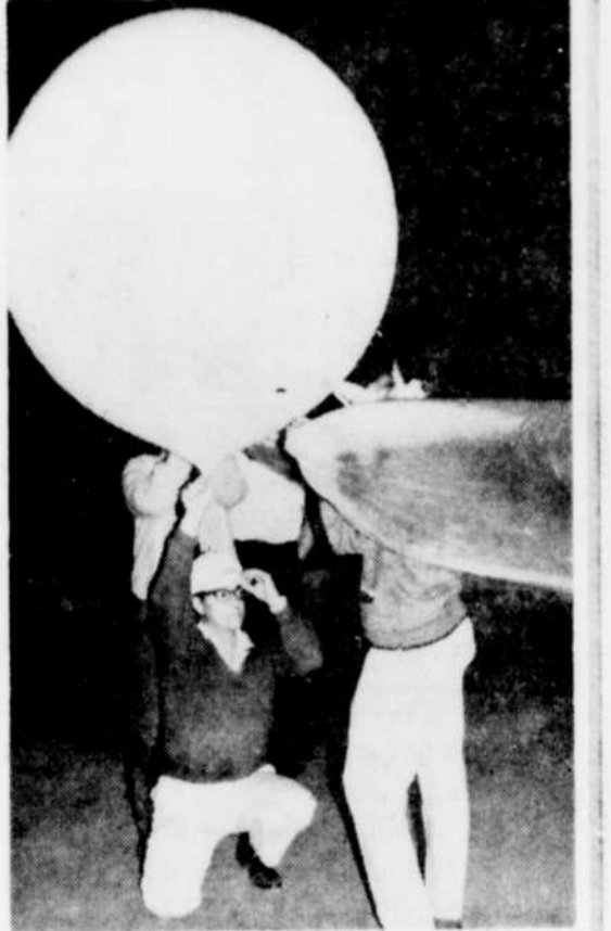
OU EST-IL? — On est sans nouvelle de ce gros ballon qui ne répond plus aux messages lancés par les techniciens de la base du parc Dollard à Asbestos. Cette photo a été prise vendredi soir, quelques minutes seulement avant le lancement.