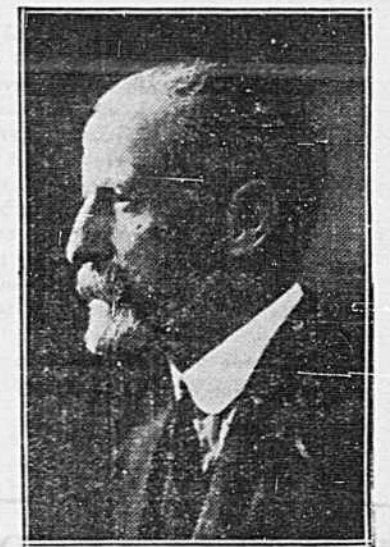
SIR F. WILLIAMS-TAYLOR Gérant général de la Banque de Montréal.

Partout, à mesure que les conditions s'y prêtaient la Banque ouvrit des succursales pour faciliter le développement de l'agriculture canadienne, des industries manufacturières, du commerce en général.