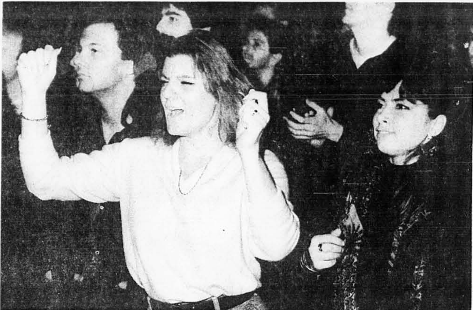
Les rythmes entraînants font toujours leur effet.

Mais la perfection dans le rock, c'est encore et aussi la capacité de rester «lousse» dans un environnement aussi imposant. Et cela,