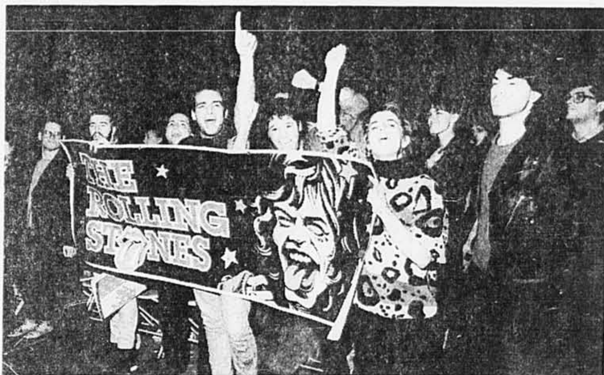
Des fans bien identifiés.

Mais que serait un show des Stones sans Mick Jagger? C'est lui, véritablement possédé par son art, qui donne au concert sa dimension humaine et théâtrale. Les écrans qui nous le montrent en gros plan, révèlent son visage dégoulinant de sueur, les veines de ses tempes gonflées au bord de l'explosion, son regard perçant concentré à l'excès. Sans acrobatie, mais parcourant les 250 pieds de la scène à la vitesse de la lumière, excellent à la guitare comme à l'harmonica, il mord dans chaque mot, avec une diction impeccable, ramenant à la vie les moindres nuances des 23 chansons qu'il interprète. En comparaison, dans Before They Make