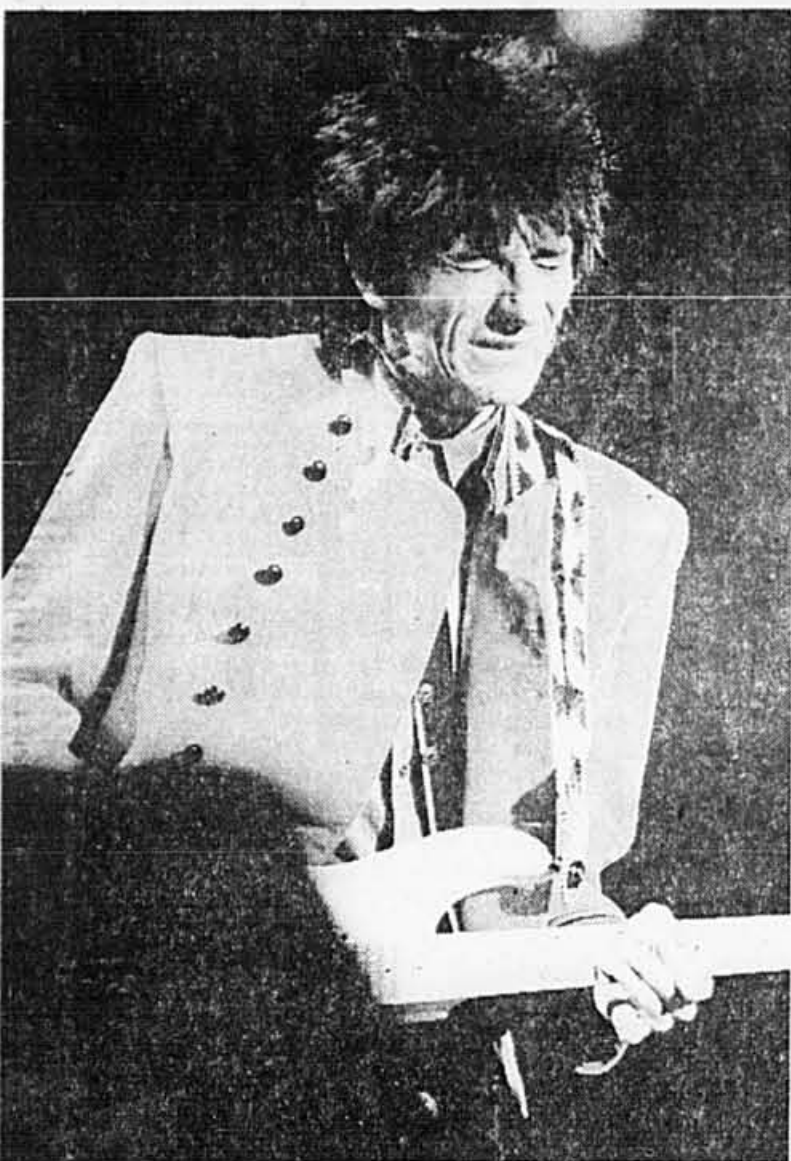
La guitare électrisante de Keith Richards.