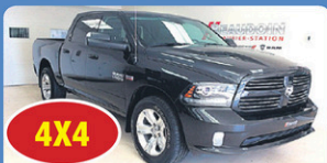
4X4 RAM 1500 CREW SPORT 2016 démarrreur, Gr élect, 24 102 km, #13797A 38 948$*