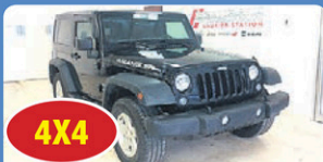
4X4 JEEP WRANGLER SPORT 2016 Manuel 6 vitesses, int cuir, toit rigide, 40524 km, #H631B 28 948$*