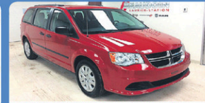
DODGE GR CARAVAN SE 2014 Gr élect, A/C, Stow&Go, 25 948 km, #H736A 15 948$*