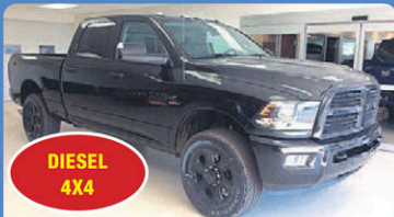
DIESEL 4X4 RAM 2500 SLT 2017 édition BLACK, boîte 6,5 pieds, #H564A 60 948$*