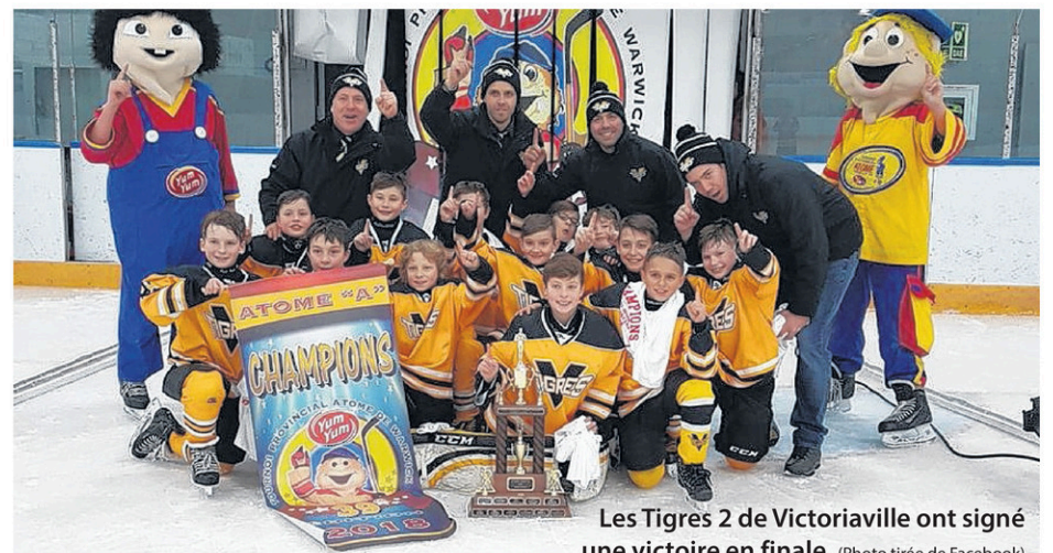
Les Tigres 2 de Victoriaville ont signé une victoire en finale.

En finale, le V. Boutin a signé une victoire de 2 à 0 contre le Grayson A.W.K, alors que les Tigres l'ont emporté 5 à 1 devant les Éclaireurs 2 de Lévis.