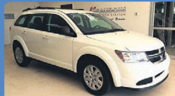
DODGE JOURNEY SE 2017 Gr Électrique, Bluetooth, #H716A 20 948$*