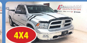
4X4 RAM 1500 SLT 2012 cabine Quad cab, Gr élect, 5 places, 49 412 km, #H423A 25 948$*