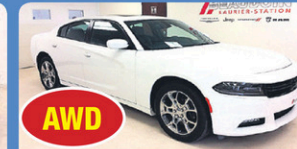
AWD DODGE CHARGER SXT 2016 int cuir, caméra de recul, toit ouvrant, 24 956 km, #13769A 28 948$*