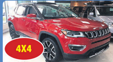
4X4 JEEP COMPASS LIMITED 2017 tout équipé, int cuir, GPS, #H645A 39 948$*