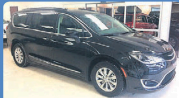
CHRYSLER PACIFICA TOURING 2017 int cuir, GPS, caméra de recul, #H753A 39 948$*