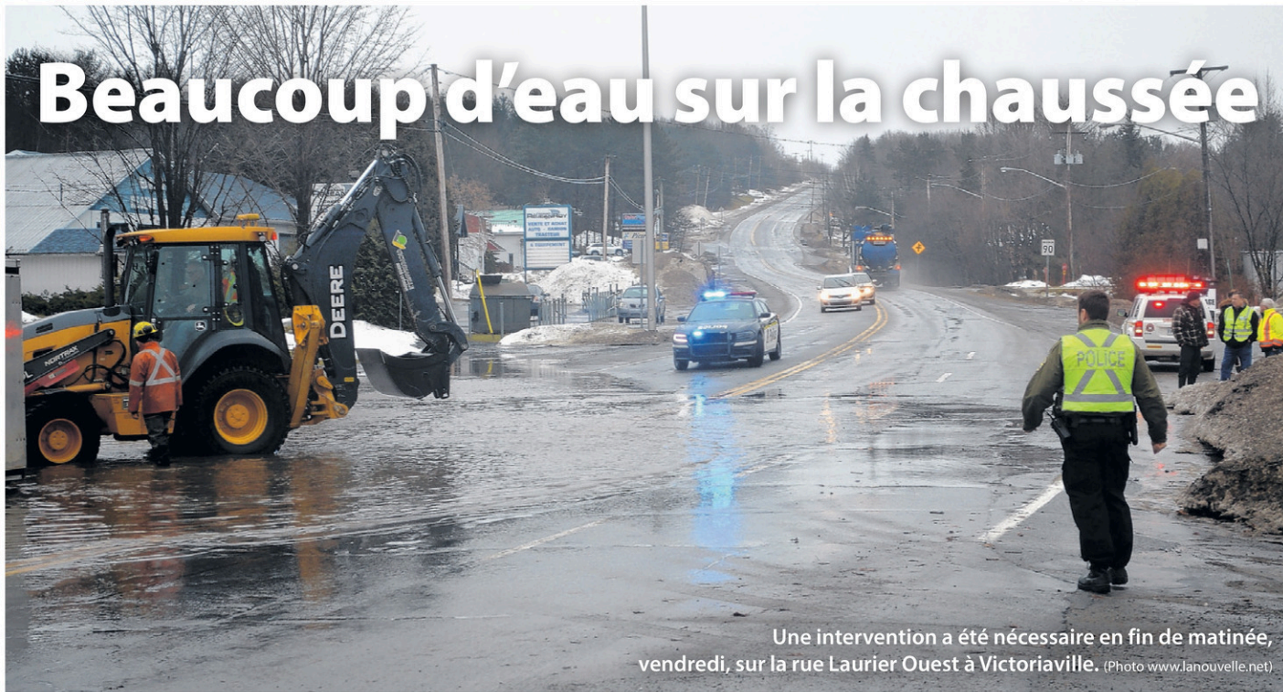
Une intervention a été nécessaire en fin de matinée, vendredi, sur la rue Laurier Ouest à Victoriaville.