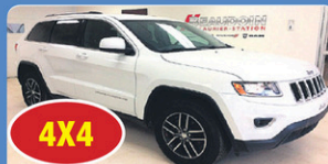
4X4 JEEP GR CHEROKEE LAREDO 2016 Gr élect, Bluetooth, 30 645 km, #13703A 32 948$*