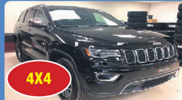
4X4 GR CHEROKEE LIMITED 2017 ensemble de luxe, toit ouvrant panoramique, #H675A 47 948$*