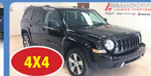
4X4 JEEP PATRIOT 2017 automatique, int cuir, toit ouvrant, 26 456 km, #13820A 22 948$*