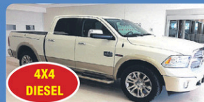
4X4 DIESEL RAM 1500 LONGHORN 2016 tout équipé, avec RAMBOX, 58 016 km, #H724A 42 948$*