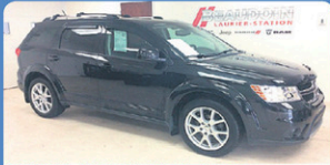
DODGE JOURNEY SXT 2012 Siège élect, Bluetooth, 89 123 km, #H344B 11 948$*