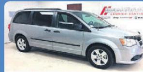
DODGE GR CARAVAN SE PLUS 2016 Gr élect, tout équipé, 28 526 km, #H548A 20 948$*