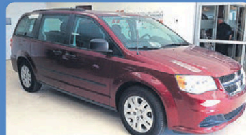
DODGE GR CARAVAN 2017 Gr élect. H324A 22 900$*