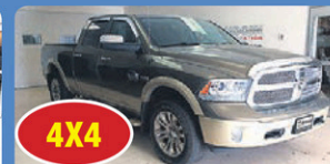
4X4 RAM 1500 LONGHORN 2015 tout équipé, GPS toit ouvrant, 61 245 km, #13759A 37 948$*