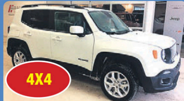
4X4 JEEP RENEGADE NORTH 2017 automatique, caméra de recul ensemble temps froid, H806A 28 948$*