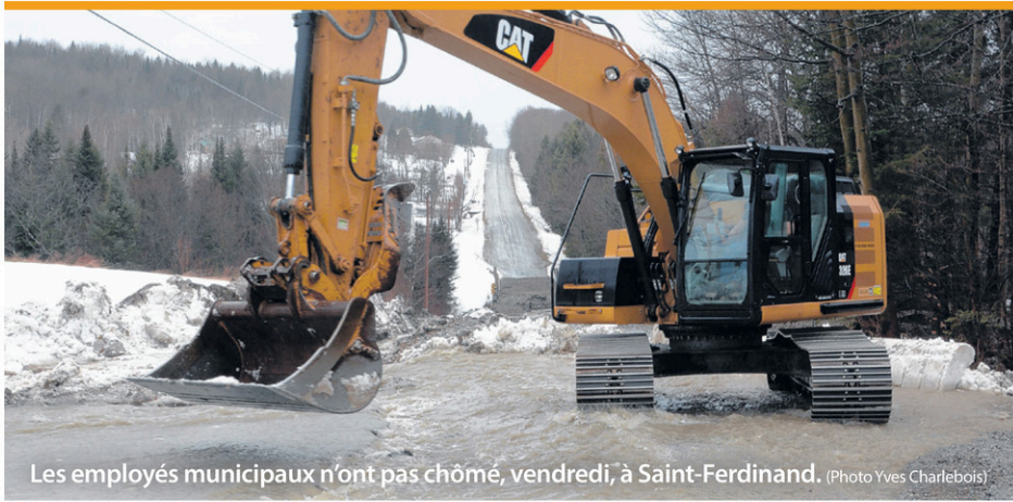
Les employés municipaux n'ont pas chômé, vendredi, à Saint-Ferdinand.