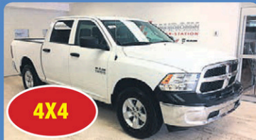
4X4 RAM 1500 CREW SXT 2017 V6, boîte de 5,7 pieds, Bluetooth, attache remorque, #H297A 33 948$*