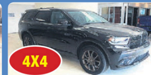
4X4 JEEP DURANGO GT 2017 int cuir, caméra de recul, Démarrreur, 5 423 km, #13778A 39 948$*