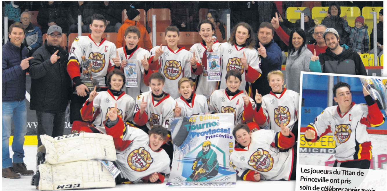
Le Titan de Princeville a soulevé la bannière dans la catégorie bantam A.

Dans la catégorie bantam B, les Tigres 1 ont été sacrés champions du tournoi. En grande finale, ils ont eu le dessus 3 à 1 sur les Tigres 2. En demi-finale, ces équipes avaient respectivement affronté les Gaulois de Saint-Hyacinthe et le Desjardins de Farnham/Bedford. La compétition se poursuivra la fin de semaine prochaine avec la présentation des parties de catégories midget A et midget B au Centre sportif Paul-de-la-Sablonnière.