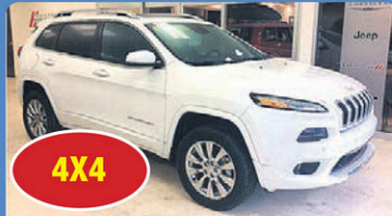
4X4 JEEP CHEROKEE OVERLAND 2017 ensemble technologie, toit ouvrant panoramique, tout équipé, #H617A 39 948$*