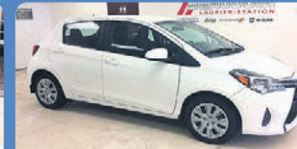
TOYOTA YARIS 2016 automatique, caméra de recul, Bluetooth, 54 123 km, #13817A 14 948$*