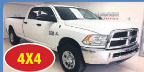
4X4 RAM 2500 CREW SLT 2016 Gr élect, 6 places, 43 523 km, #13800A 46 948$*