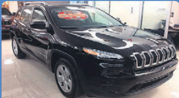
JEEP CHEROKEE SPORT 2017 attache remorque, caméra de recul, équipement temps froid, #H648A 27 948$*