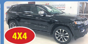
4X4 JEEP GR CHEROKEE OVERLAND 2017 GPS, Toit Ouvrant, Démarrreur, 8 845 km, #J076A 49 948$*