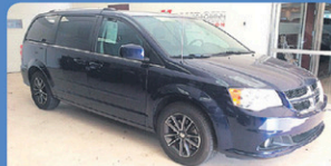
DODGE GR CARAVAN SXT 2017 caméra de recul, tout équipé, 19 542 km, #13811A 28 948$*