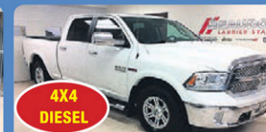
4X4 DIESEL RAM 1500 CREW LARAMIE 2014 toit ouvrant, démarrreur, Gr élect, 105 125 km, #H571B 32 948$*