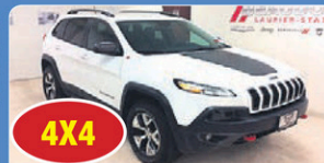
4X4 JEE CHEROKEE TRAILHAWK 2017 moteur V6, caméra de recul, Bluetooth, Gr élect, 8 456 km, #13805A 32 948$*