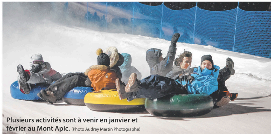
Plusieurs activités sont à venir en janvier et février au Mont Apic.

Parmi les activités inscrites à la programmation annuelle, deux se tiendront en janvier, soit le « World Snow Day » et la journée de la patrouille le 21 janvier ainsi que la soirée du président le 27 janvier. Deux autres se dérouleront en février, soit la compétition Optimiste le 3 février et le Mont Apic sous les étoiles le 17 février. Il va sans dire que l'activité du Mont Apic sous les étoiles est la plus achalandée de l'année alors que la plupart des municipalités de la MRC de L'Érable défraient 50% du coût d'entrée de leurs résidents. L'événement se clôture avec les traditionnels feux d'artifice.