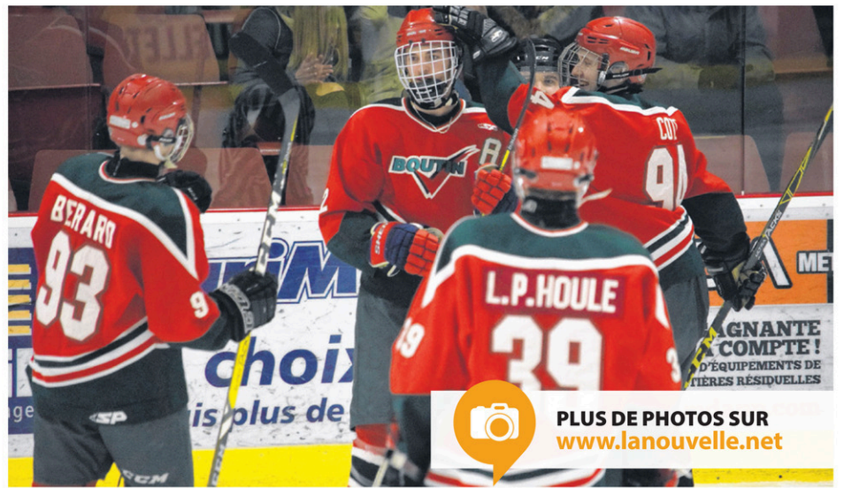
Les joueurs du V. Boutin ont eu plusieurs occasions pour célébrer lors de leurs deux matchs contre le Cité construction de Disraeli.

Les Plessisvillois affronteront deux équipes lors de la prochaine fin de semaine. D'abord, ils recevront la visite des Canotiers de Montmagny vendredi soir. Puis, ils se mesureront au Lafontaine de Bellachasse, à Sainte-Claire, samedi.