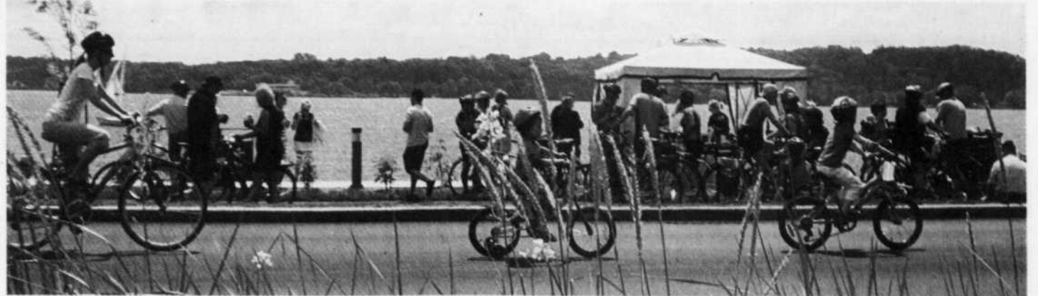
Plusieurs cyclistes ont interrompu leur balade pour écouter Jean Charest et les autres politiciens qui ont inauguré la promenade Samuel-De Champlain.