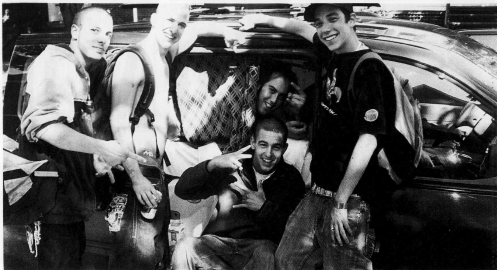
ANTOINE ROBITAILLE LE DEVOIR

Rien de plus normal que d'être courbaturé après avoir fêté une bonne partie de la nuit avant d'aller dormir quelques heures dans sa voiture.