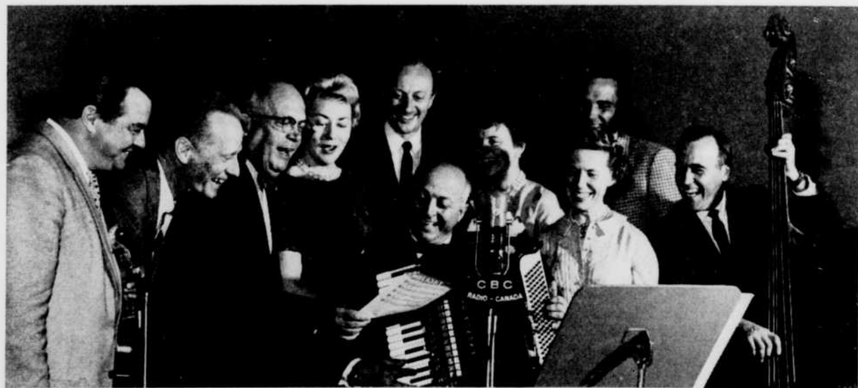
Si l'émission radiophonique les Joyeux Troubadours est la plus populaire au Canada, nous connaissons maintenant la clé du succès. Une équipe aussi riieuse ne peut semer que de l'entrain et de la bonne humeur.

Québécois, craignez pour votre Carnaval d'hiver ! L'humour de Chez Miville passera par là.