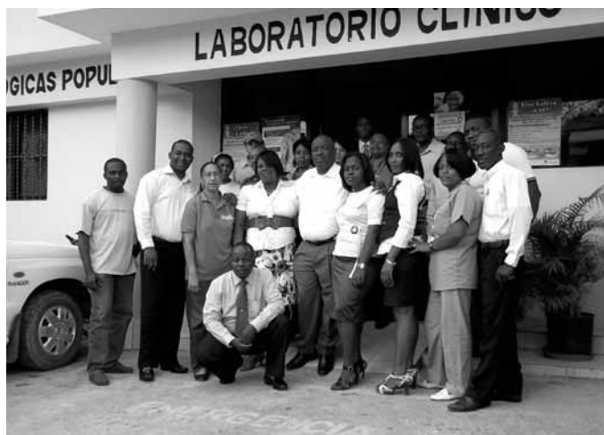
↑ L'équipe de l'organisme dominicain MOSCTHA (Movimiento Socio-Cultural de los Trabajadores Haitianos)

Le séisme en Haïti a marqué profondément le cours du programme de coopération et a augmenté les risques menaçant son bon déroulement. Si du côté des partenaires dominicains les projets se sont déroulés normalement selon le calendrier établi, de l'autre côté de la frontière, le 12 janvier 2010 a laissé un lourd bilan qui se traduit par des pertes matérielles pour les partenaires haïtiens au risque de compromettre les résultats des projets. La poursuite des projets sur le terrain, mais surtout le relèvement des organismes partenaires sont devenus des préoccupations majeures qui ont motivé et orienté notre travail. Nous continuons de les appuyer moralement et financièrement ainsi que par l'intermédiaire des projets binationaux. Nous sommes fiers des résultats et encore plus de savoir qu'en cette année 2011, nos partenaires haïtiens sont debout et leurs interventions continuent de toucher positivement les populations les plus vulnérables.