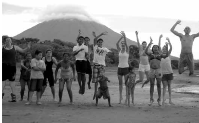
↑ Le groupe de Puesta del Sol au Nicaragua lors d'une activité récréative avec des membres de la communauté.