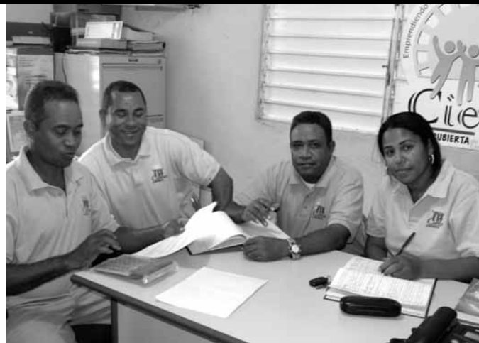
↑ L'équipe du CIEPO, organisation dominicaine.