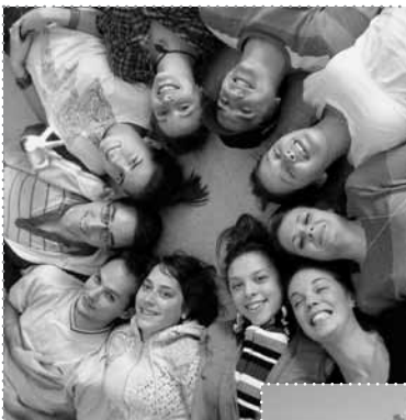
← Costa Rica, ACTUAR, Isla Chira