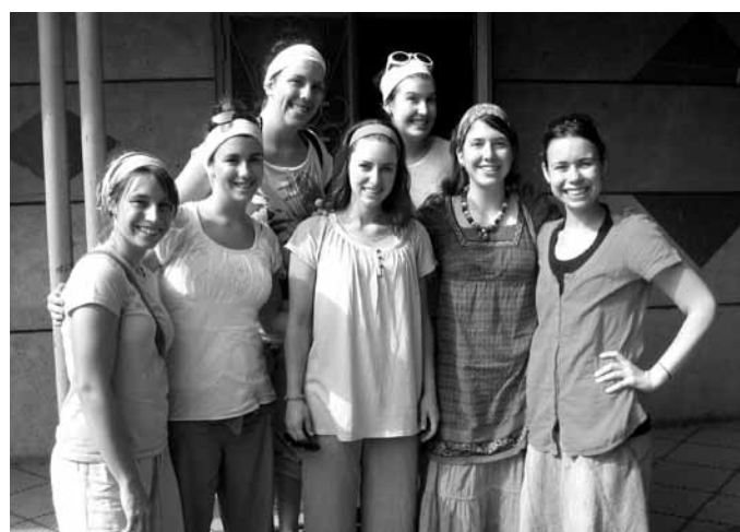
↑ Les stagiaires et l'accompagnatrice du groupe du Mali dans leur communauté d'accueil.

Chaque année, des jeunes âgés de 18 à 35 ans participent aux stages internationaux de groupe ou individuels offerts par Plan Nagua. Ces stages sont organisés en collaboration avec des organismes partenaires locaux et permettent aux jeunes participants de prendre part à un projet de coopération tout en vivant une expérience interculturelle des plus enrichissantes. Plan Nagua offre aux participants une formation pré-départ ainsi qu'un encadrement afin de maximiser l'expérience de chacun et les retombées de leur séjour.