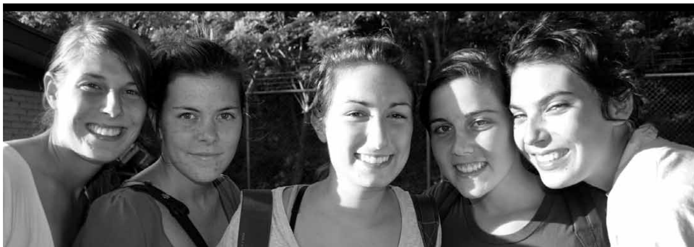
↑ Le groupe de l'ACJ du Nicaragua lors du séjour sur le terrain.