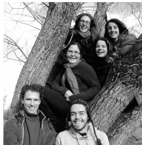
→ Le groupe partant pour Boruca au Costa Rica lors d'une fin de semaine de formation.

Confronté aux enjeux de développement durable, le programme des stages internationaux mise principalement sur l'échange interculturel entre les jeunes d'ici et d'ailleurs. Nous croyons fermement qu'un tel échange permet une meilleure compréhension du monde, en plus de favoriser le changement de mentalités et de comportements et, par le fait même, le processus de transformation et de réorientation des sociétés. Tous les jeunes sont sensibilisés à la notion de développement durable, ils sont exposés à différentes sources d'information et peuvent ainsi contribuer à faire connaître les avantages pertinents ici et ailleurs dans le monde.