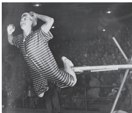
Humour et musique! - 4 février 2015 Laval, 1956. Acrobate burlesque. | Crédit : Centre d'archives de Laval, Fonds Club nautique des Mille-Îles.