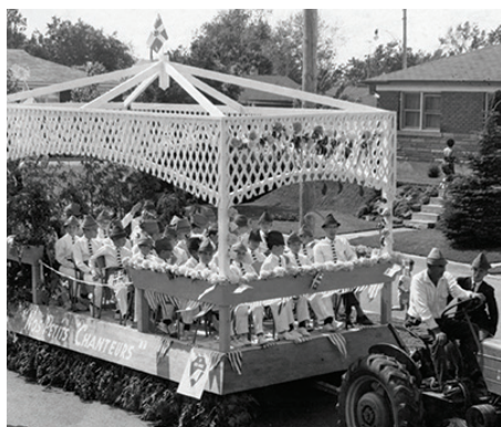
Casse-noisette et opéra - 10 déc. 2014 Laval, 1963. Char allégorique « Nos petits chanteurs » lors d'un défilé, à Sainte-Rose.