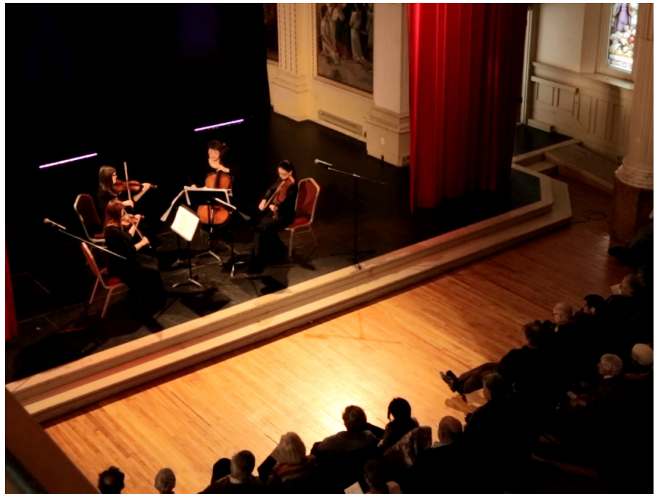
Concert du 14 février 2015.