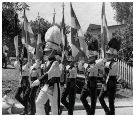
Autour de l'Histoire du soldat de Stravinski 25 avril 2015 Laval, 1963. Parade à Sainte-Rose | Crédit : SHGIJ, Fonds Jacqueline Ouimet-Fournier.