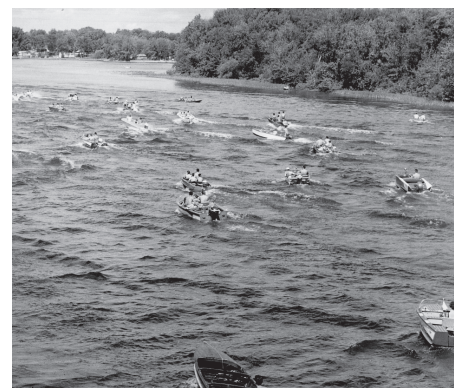
Au fil de l'eau - 6 mai 2015 Laval, 1960. Parade nautique sur la rivière des Mille-Îles