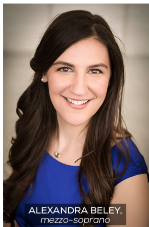
ALEXANDRA BELEY, mezzo-soprano