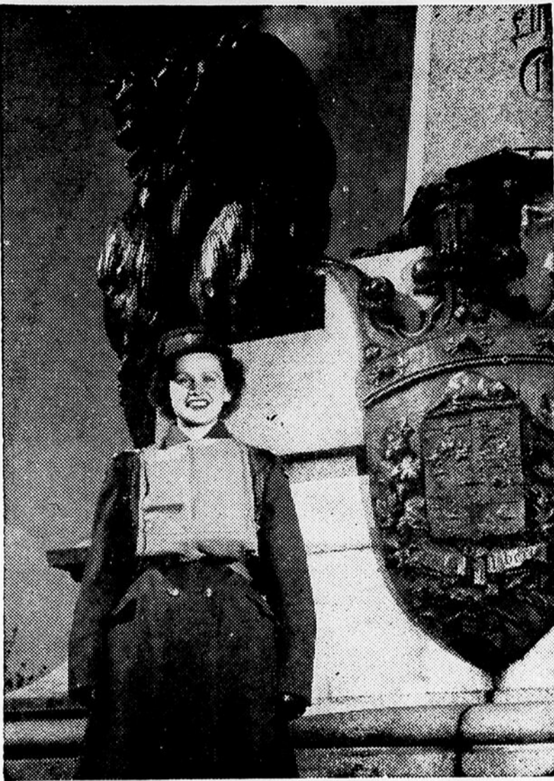
Quand on a tout ça, on peut aider à gagner la guerre! Voilà du moins ce qu'a l'air de penser cette jolie capitaine en charge du premier groupe du Corps auxiliaire des femmes canadiennes à se rendre en Angleterre. Ce groupe comprenait 104 membres et de nouvelles recrues iront bientôt les rejoindre.