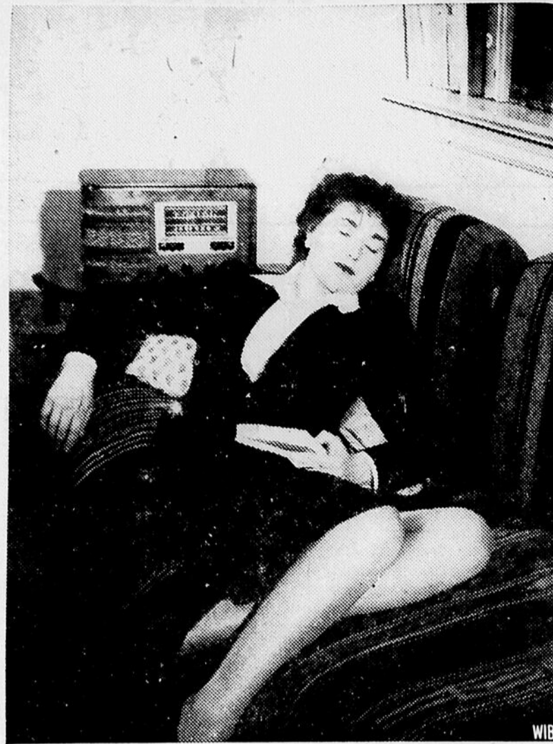
La musique rend moins vides les heures de solitude et d'ennui. Il n'y a cependant pas de raisons de laisser la radio ouverte pendant son sommeil et gaspiller ainsi de l'énergie électrique, si nécessaire aux usines de guerre du pays. Écoutons les bons programmes et fermons ensuite la radio au lieu de se fatiguer la tête toute la journée durant avec des histoires ou de la musique plus ou moins intéressantes.