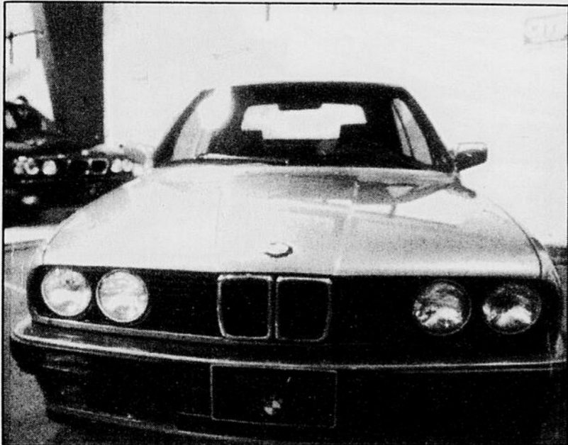
BMW juge que le marché de l'automobile a beaucoup évolué et qu'il faut maintenant miser sur la qualité plutôt que le luxe de certains modèles pour convaincre le consommateur.