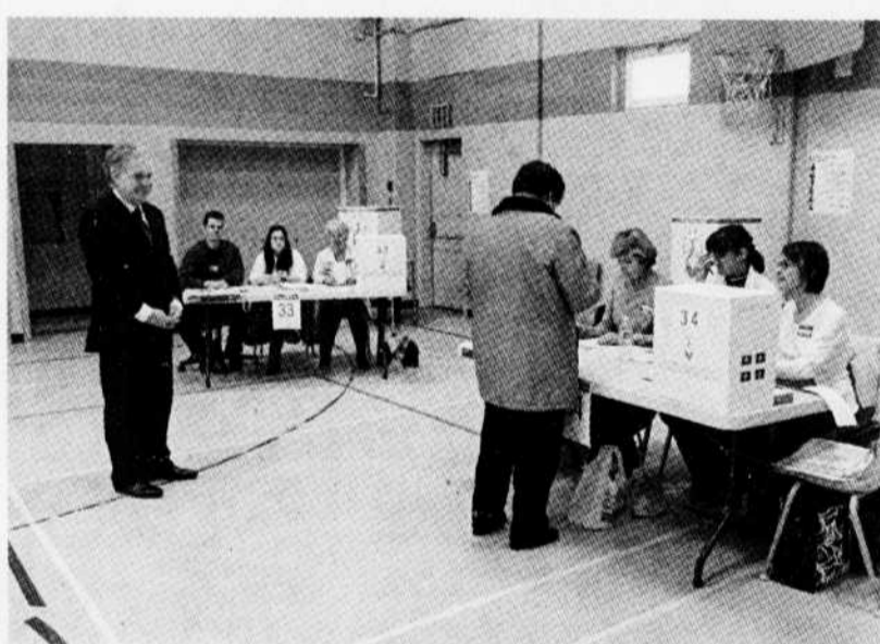
Cette élection n'avait pas lieu d'être. Le peuple le savait. Il l'a dit. On s'est foutu de sa gueule. Il s'est foutu de la gueule des politiciens.

On lui a dit qu'il y avait une récession MONDIALE et qu'une tempête terrible allait s'abattre. Aucun plan, aucun chiffre. Plutôt des millions et des milliards. Et dans un type d'État sans grands pouvoirs, sans ressources significatives et sans accès aux forums où s'élaborent les solutions durables. Quand c'est MONDIAL, ce n'est pas provincial, ça regarde Ottawa. Quand c'est l'économie, ce n'est pas les services, ça le regarde aussi. D'ailleurs,