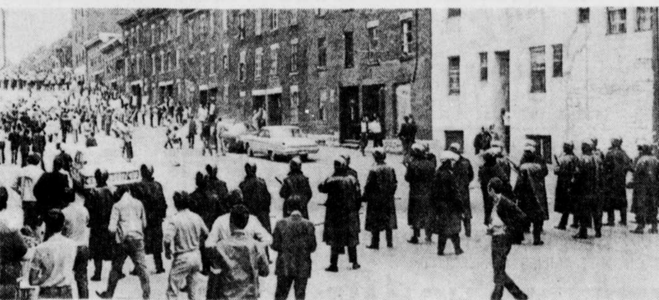
BARRICADE A MONTREAL — Les policiers ont formé une véritable barricade humaine afin d'empêcher les centaines de manifestants du Front de Libération populaire qui manifestaient, hier soir, à Montréal, d'atteindre l'hôtel de ville. Cette manifestation, à tendance séparatiste, s'est déroulée dans le calme grâce à la vigilance de la police.

L'état de la victime était considéré comme sérieux, mais non critique au moment de mettre sous presse.