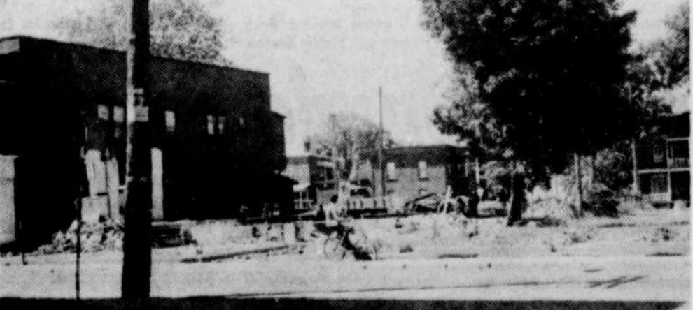
NOUVELLE RUE — Les travaux vont bon train en vue d'ouvrir la rue Dubord dans l'ouest de la ville de Victoriaville. Cette rue ira rejoindre la rue Académie. Ces travaux s'inscrivent dans le programme de rénovation urbaine du centre-ville de la ville reine des Bois-Francis.