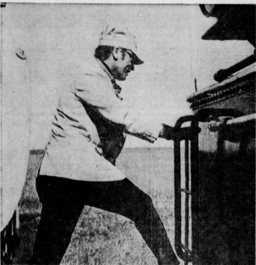
M. Trudeau, en dehors des cérémonies officielles, a tenu, comme d'habitude, à fêter à sa façon le jour de la Confédération. Alors qu'un train à vapeur archaïque transportait les ministres du cabinet fédéral à Fort Carry près de Winnipeg, il s'est "amusé" à faire quelques acrobaties entre le premier wagon et le "tender" à charbon. Il a dit lui-même que cette fête était "un jour de réjouissance".