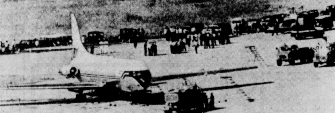
ECHEC DES PIRATES — La police et les pompiers de Rio de Janeiro sont parvenus, hier, à prendre au piège cinq pirates de l'air qui avaient tenté de détourner un avion brésilien en les incitant à atterrir, puis ensuite en cravant les pneus de l'avion et en injectant des gaz lacrymogènes dans la carlingue.

Les pompiers réussirent à introduire dans la carlingue, par l'arrière de l'avion un mélange qui, selon le lieutenant Gavel, contenait des gaz lacrymogènes, de la mousse anti-incendie, de la fumée opaque et aussi du sable. Le tout suffoqua et paralysa probablement passagers et pirates. Les pompiers et des policiers de l'air firent alors irruption dans la carlingue par la porte de secours arrière et peu après les passagers et l'équipage étaient évacués.