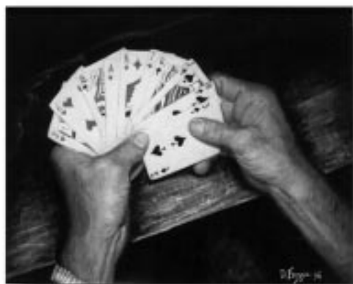
DIANE FREZZA — Romain cinq cents 16" x 20"