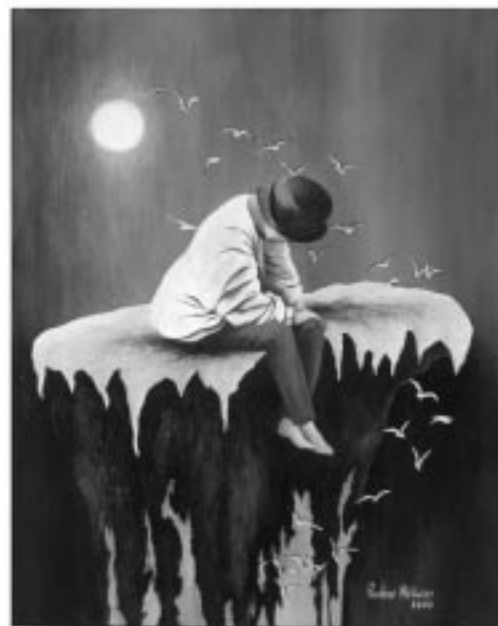
PAULINE MÉTIVIER — Sans titre 14" x 18"

Ces personnes verront leur œuvre publiée dans le numéro spécial d'automne 2000, de la revue Santé mentale au Québec .