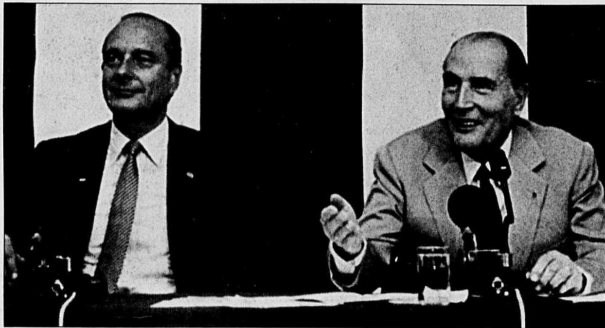
Jacques Chirac et François Mitterrand, à l'époque de la cohabitation de 1986.

La coalition RPR-UDF est désormais assurée d'une majorité qui, à force d'être écrasante, risque d'être inconfortable. Tout au long de cette semaine, entre les deux tours de scrutin, le parti RPR et le groupe UDF ont tenté d'assurer chacun sa prééminence au sein de la future assemblée en négociant à rebrousse-poil les désistements dans les circonscriptions où deux candidats de la droite pouvaient se maintenir. Dans ce jeu