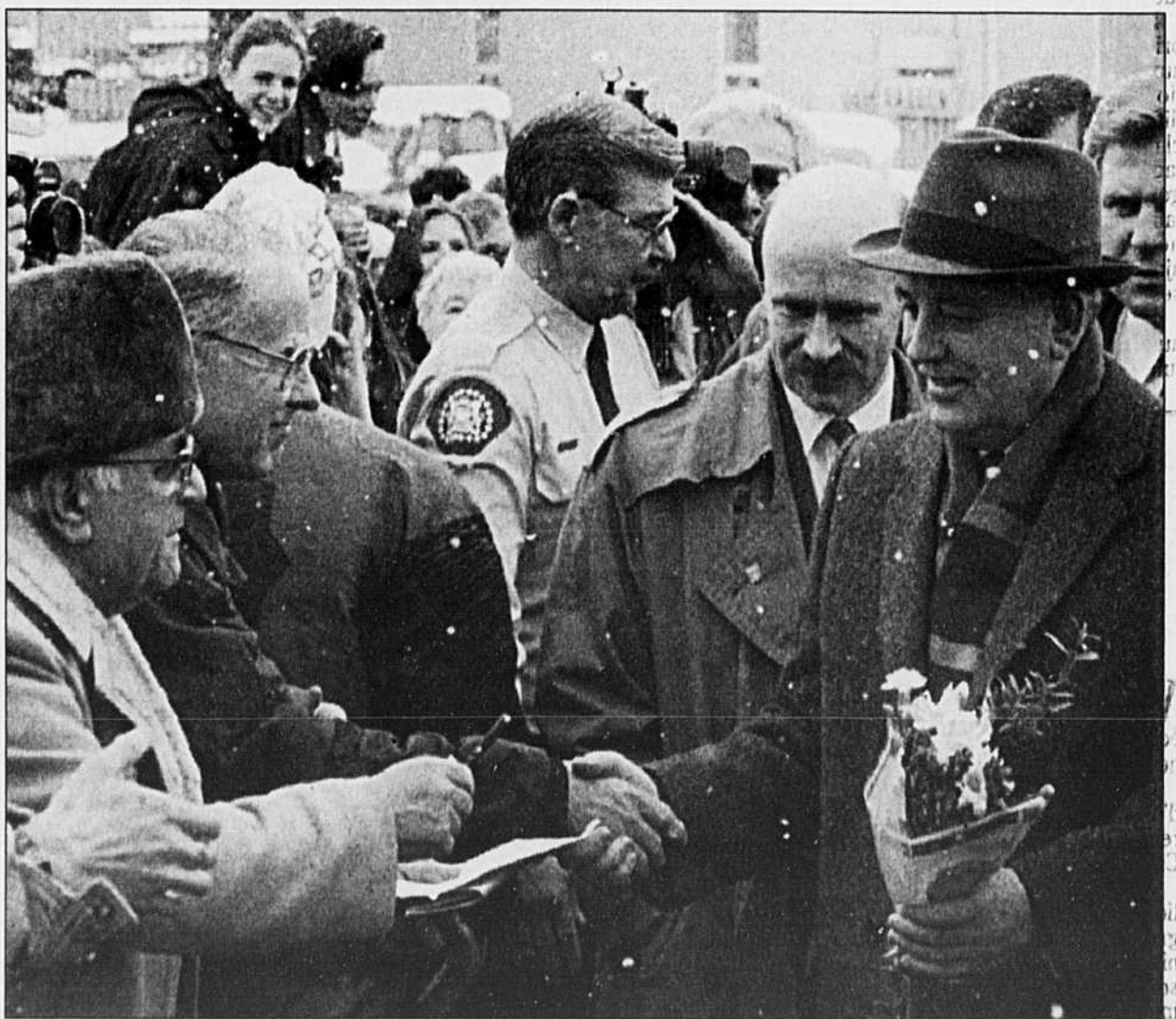
L'ANCIEN président de l'Union soviétique, Mikhail Gorbatchev, est entouré d'une foule de supporters, après avoir visité une école secondaire de Calgary. Présentement en visite au Canada, Gorbatchev sera de passage à Montréal dimanche soir et lundi.