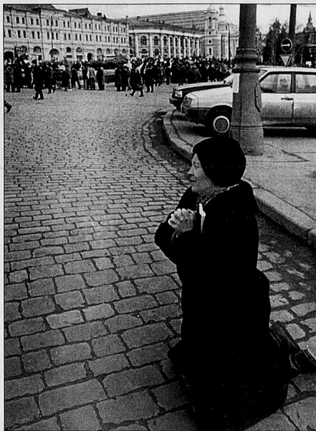
Agouillée sur la Place Rouge, cette dame prie pour que la Russie connaisse enfin la stabilité politique. A l'arrière-plan, des manifestants pro et anti Eltsine. Le parlement russe doit étudier aujourd'hui une motion de destitution du président. Nos informations, page A-5.