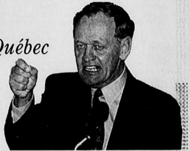
Jean Chrétien parlait hier devant la Chambre de commerce régionale de Sainte-Foy.

«Tout le monde sait qu'il s'est opposé au lac Meech et tout le monde sait qu'il l'a fait dans l'intérêt de sa population, alors pourquoi devrait-on s'excuser de ça? Pourquoi