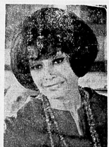
Mon pays, mes chansons... une demi-heure hebdomadaire passée à la télévision en compagnie des meilleurs chanteurs-compositeurs de chez nous, sous l'égide de PAULINE JULIEN, voilà tout un "programme" qui plaira sûrement à un très grand nombre de téléspectateurs. La première émission de cette nouvelle série sera télévisée le lundi 7 juin à 8 heures au réseau français de Radio-Canada