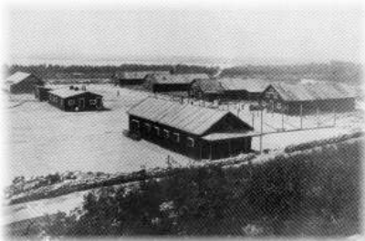
Camp Spirit Lake