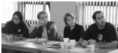
Atelier sur la réalisation d'un documentaire qui a eu lieu les 18 et 19 septembre 2004.

Soucieux de répondre aux besoins de formation du milieu des arts et de la culture de la région, nous continuons de travailler sans relâche. Ainsi, les saisons printemps/été ont été ponctuées par cinq sessions de formation. Le Conseil est particulièrement fier d'avoir donné sa toute première formation en danse qui a regroupé des professeurs en provenance de partout en région et s'est avérée un franc succès. De plus, nous avons présenté, dès le mois d'août, notre programmation automnale qui renferme des formations pour tous les goûts. Pour connaître les prochaines activités, consultez notre site Internet au www.crcat.qc.ca/formation