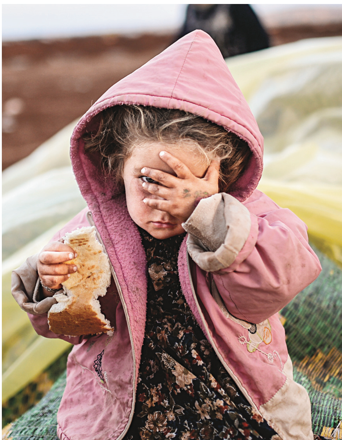
À l'instar de dizaines de milliers de Syriens, une jeune enfant d'origine kurde et sa famille ont rejoint la Turquie ces dernières semaines à la suite des combats entre Kurdes et djihadistes.