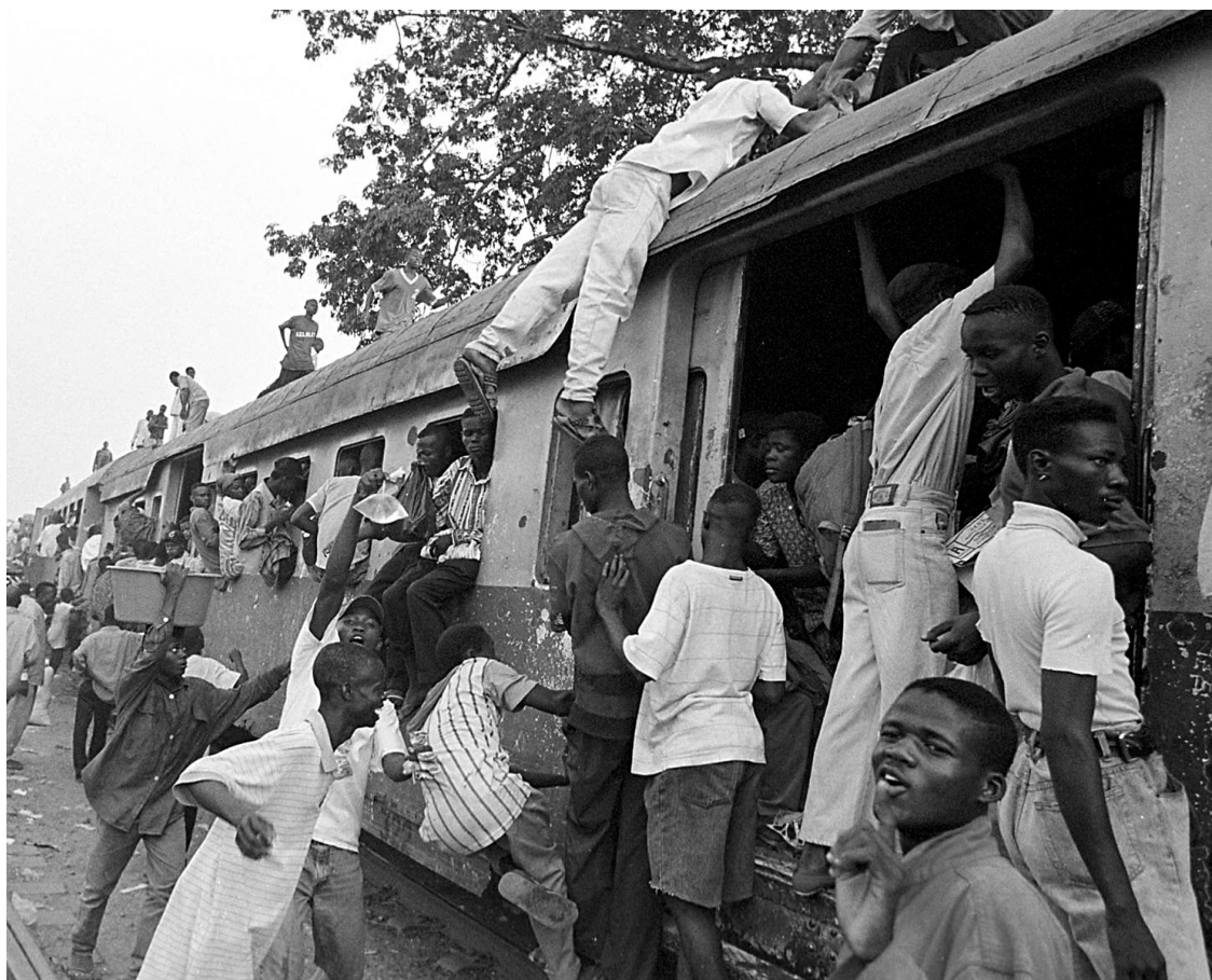
Le développement du rail a permis au VIH de sortir de son enclave. Le moyen de transport, très emprunté au Congo, a permis l'établissement de nouveaux foyers d'infection.

Les analyses du groupe de chercheurs des universités britanniques d'Oxford et belge de Louvain laissent penser qu'entre les années 1920 et 1950, une combinaison de facteurs, dont