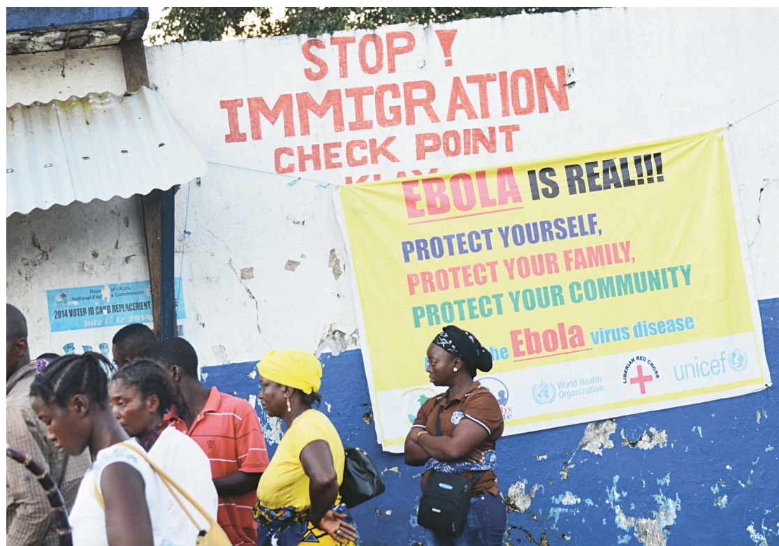
Des Libériens attendent à un poste d'immigration où un avertissement les met en garde contre Ebola.

L'épidémie — la plus grave depuis la détection du virus en 1976 — a pris naissance en Guinée en décembre. Depuis, 2069 personnes sont mortes au Liberia, 739 en Guinée, et 623 en Sierra Leone. Le taux de mortalité du virus s'élève-