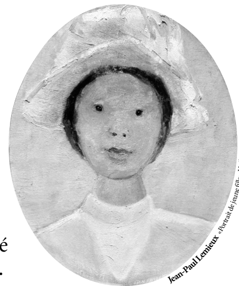
Jean-Paul Lemieux - «Vieux de France fille» - Hialeah sur table