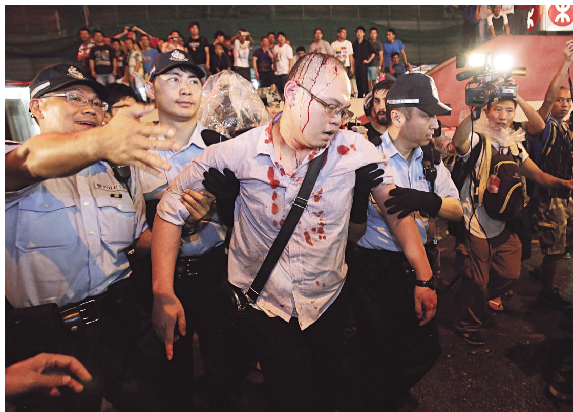
Des manifestants ont été attaqués par des résidents, dont certains étaient masqués.

Par ailleurs, des témoignages concordants ont fait état d'agressions sexuelles en plusieurs endroits de la ville, d'ordinaire considérée comme