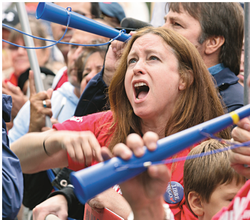
JACQUES NADEAU LE DEVOIR La Coalition promet une journée de «grand dérangement», mais soutient qu'elle se fera dans le calme, comme la marche du 20 septembre dernier.

La Coalition, qui regroupe 65 000 syndiqués, entend utiliser la voie des tribunaux pour contester le projet de loi. «On n'attendra pas que le projet de loi soit sanctionné. Sur le plan juridique, on va faire tout ce qu'il