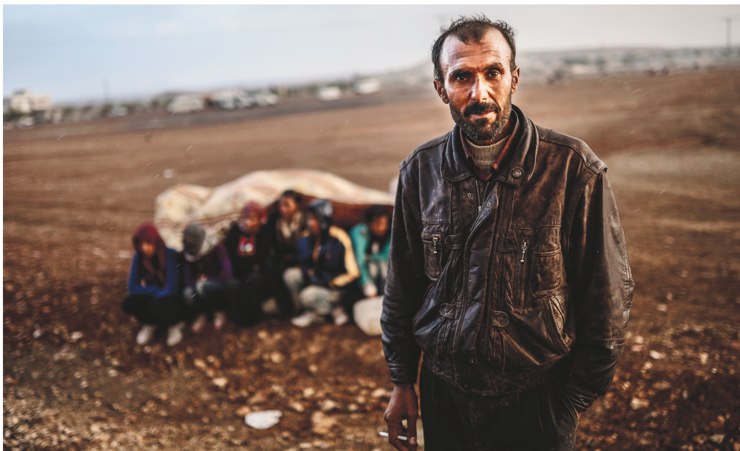
Les réfugiés kurdes affluent à la frontière turque. La ville de Kobané, en Syrie, est le siège d'importants combats contre les djihadistes de l'EI.