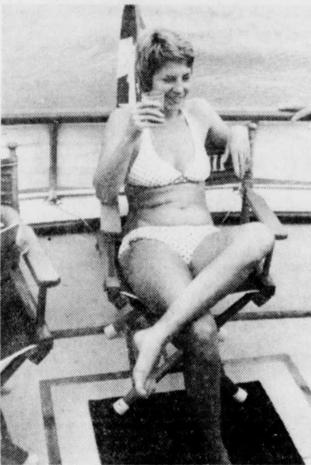
$50 par mois aux femmes mariées?

Ma fierté de canadien-français en prend du poids. Là-dedans, cela me fait lourd d'orgueil cette nomination du gouverneur-général Léger.