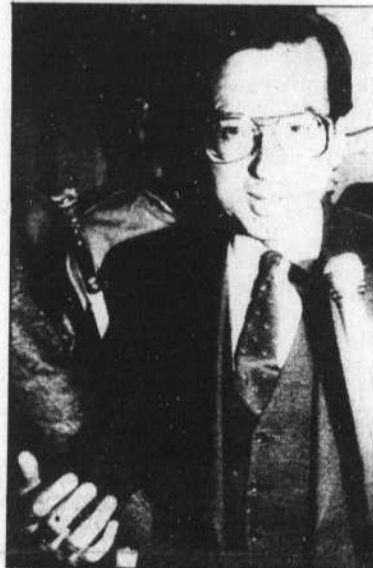
M. Robert Bourassa

■ d'un côté, les provinces ont accepté que la négociation soit menée