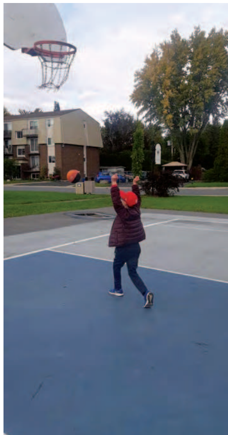
Les jeunes des Amis-Soleils profiteront de nouveaux modules de jeu x adaptés.

« C'est une nouvelle qui nous touche droit au cœur. » - Lyanne Levasseur Faucher