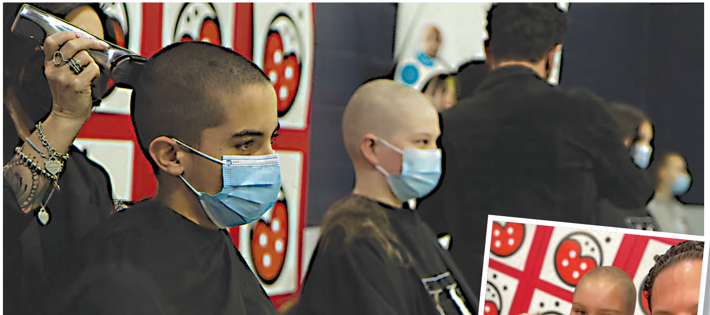
Vingt personnes du Collège Trinité ont accepté de relever un Défi têtes rasées.

Le Défi têtes rasées est une activité de financement importante de Leucan, qui mobilise la communauté dans un élan de solidarité. Il permet d'offrir des services aux familles d'enfants atteints de cancer et d'investir dans la recherche clinique. C'est aussi un geste de soutien envers ces enfants qui subissent, lors de la chimiothérapie, une modification de leur image corporelle par la perte des cheveux. « La pandémie aurait pu mettre un frein à la générosité des gens, mais la collecte du Collège Trinité, qui est toujours une très belle réussite au fil des années, témoigne que la