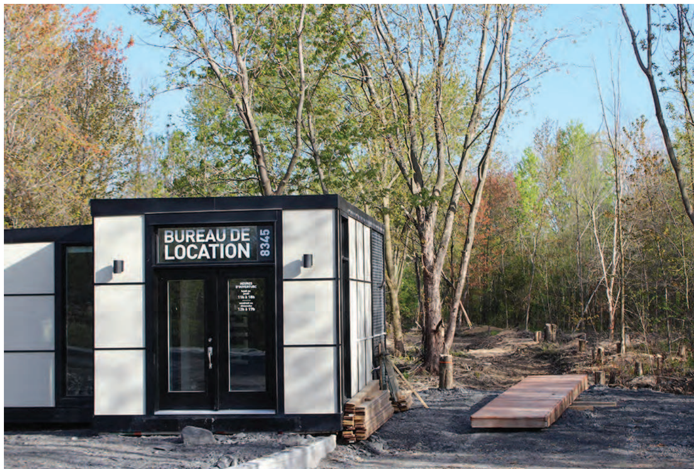
Les futurs logements situés proches du boulevard Seigneurial sont en location.

Ludovic Grisé-Farand a pris la parole lors du dernier conseil pour rappeler que ce projet avait été possible « car Saint-Bruno a perdu une poursuite pour expropriation déguisée. En termes de stratégie, laisser pourrir des dossiers en cour pour le conseil n'est pas à notre avantage. On aurait intérêt à présenter aux citoyens tous les boisés que