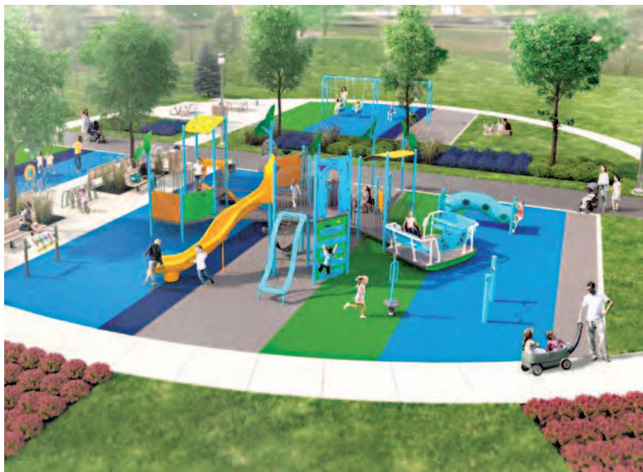
De nouveaux modules de jeux adaptés seront aménagés au parc Albert-Schweitzer.

La surface de jeux en tapis et l'ajout de trottoirs permettront une accessibilité en fauteuil roulant ou en poussette adaptée. Les balançoires, conçues avec des sièges adaptés équipés de harnais de sécurité, pourront supporter jusqu'à 150 livres. Les escaliers élargis, la balançoire gondole accessible en fauteuil roulant, les fontaines abaissées pour se désaltérer... ne sont que quelques aspects de ces nouveaux modules de jeux adaptés. Ils ont été choisis avec attention afin de convenir aux différents besoins de la clientèle. Des espa-