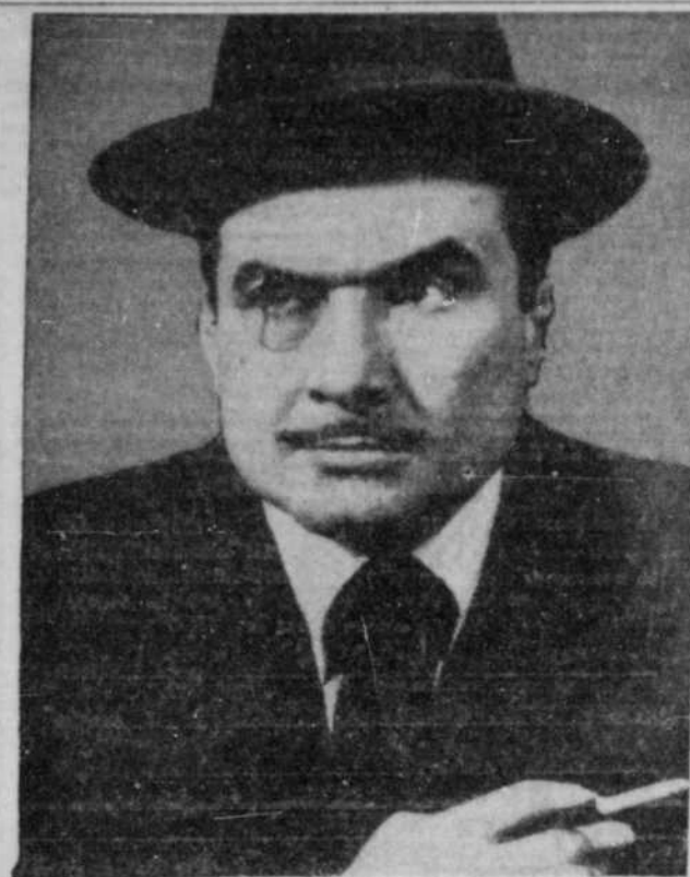
LORD SPEARS AU MANÈGE DES FUSILIERS — Les séances de lutte reprendront demain soir au Manège des Fusiliers, rue Belvédère, alors que le fameux Lord Spears, le lutteur qui s'est fait une réputation par ses spectacles à la télévision, rencontrera dans la finale le "Blond Atomique" Ted Evans, champion poids lourd junior. D'autres rencontres sont au programme.